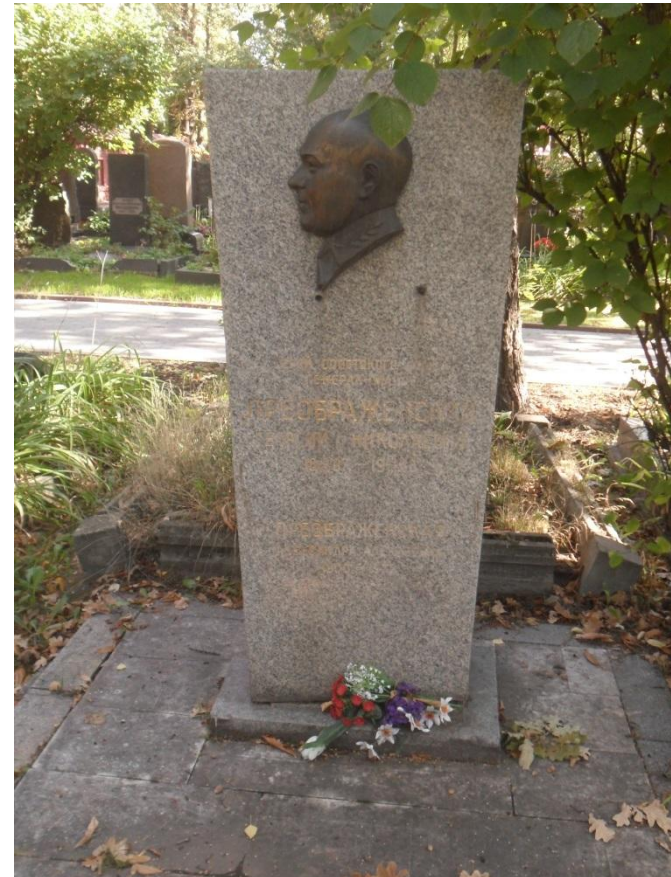
Могилы Преображенского Г.Н. на Новодевичьем кладбище Москвы.