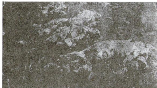
Жертвы злодеяний фашистов