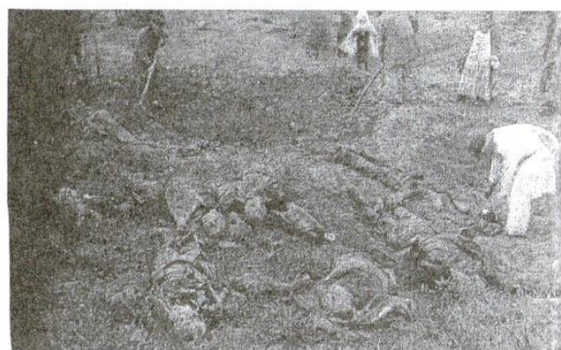
Жертвы злодеяний фашистов