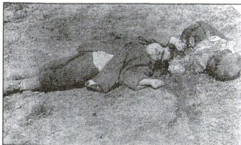
Изверги-фашисты не щадили детей. Они убивали их без разбора за то, что они советские люди.