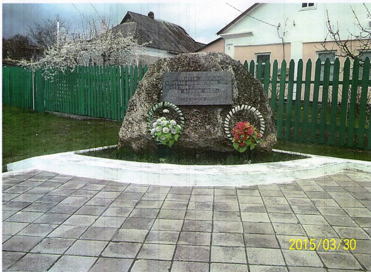
Фото автора презентации Казаковой Т.Л. 2015г.