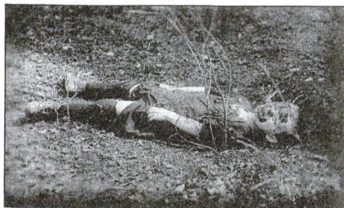
Взгляните! Этот ребенок пулями фашистов обезображен до неузнаваемости.

(СТРАНИЦЫ ИЗ КНИГИ В.ОСИПОВА «ЗАМЕТКИ КРАЕВЕДА»)