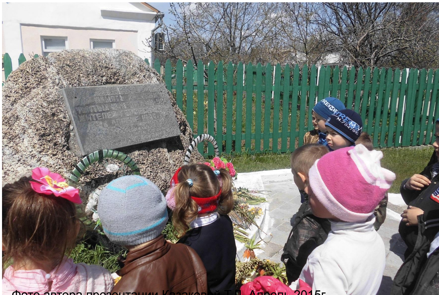
Апрель 2015г.