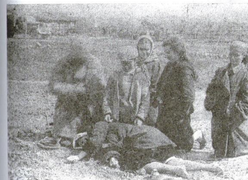
Слезы и горечь оставили после себя в городе немецко-фашистские палачи и убийцы