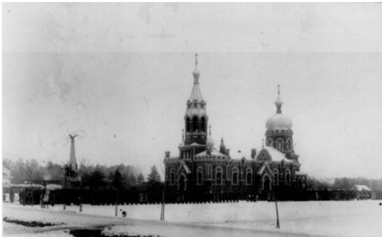
Парад 148-го пехотного Каспийского полка в день 100-летнего юбилея около церкви св. великомученицы Анастасии Узорешительницы (слева - памятник каспийцам, павшим в войну 1904-05, скульптор М. Харламов)