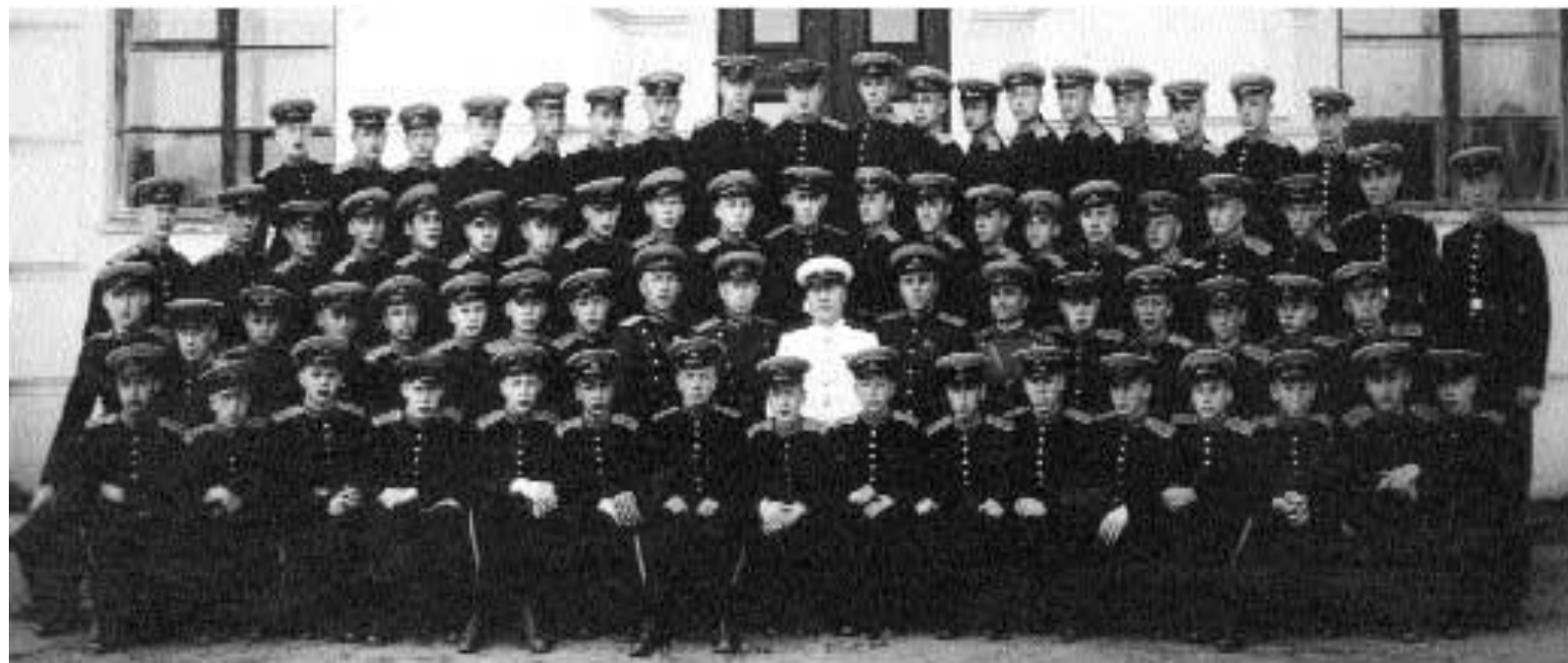
Воспитанники ЛСВУ, 6-ая рота.