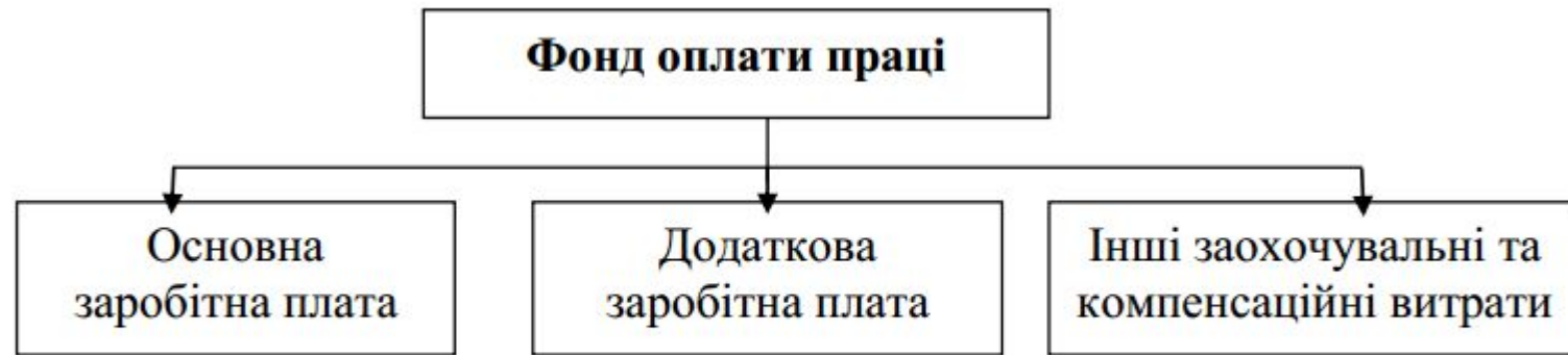
Рис. 12.1 – Види заробітної плати