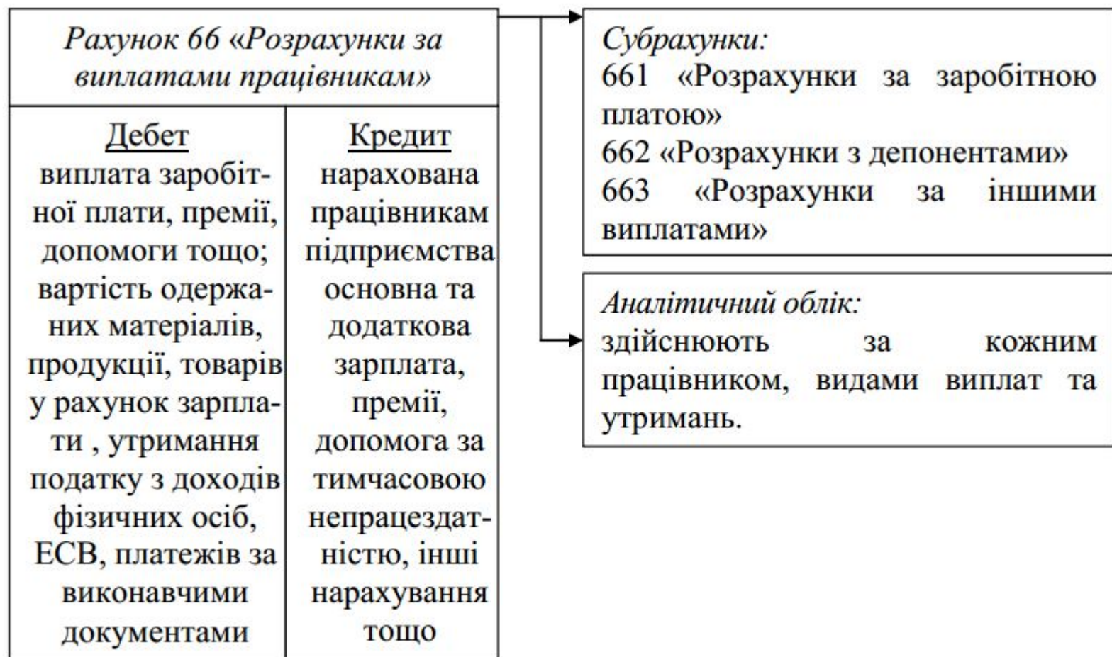
Рис.12.5 – Структура рахунка 66 «Розрахунки за виплатами працівникам»