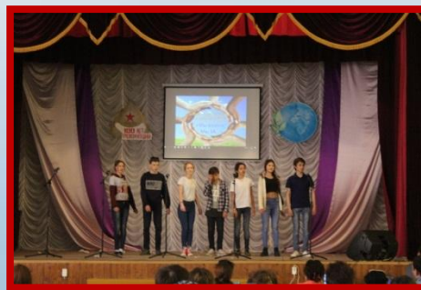
Районный фестиваль агитбригад «Мы вместе! Мы ЗА...»