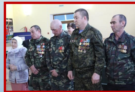
День вывода войск из Афганистана. День памяти воинов-интернационалистов