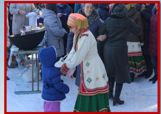
Народное гуляние «Науруз-байрам»