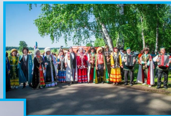
Народный праздник «Уйын» 2016г.