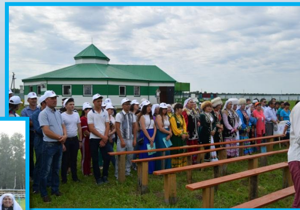
Молодежный фестиваль «Табын-фест» 2017г.