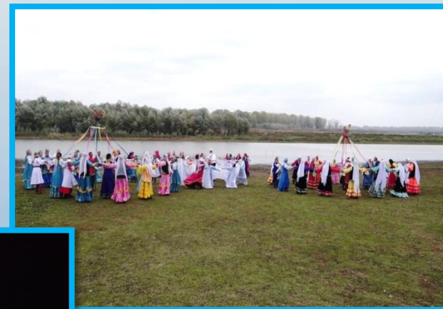
26-й Международный Аксаковский праздник 2016г.