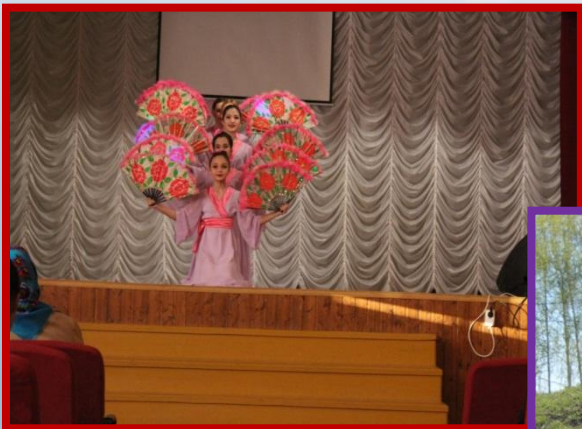
Детский танцевальный коллектив «Нур»