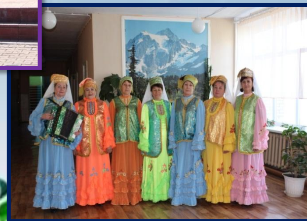
Татарский вокальный коллектив «Яшлегем моннары»