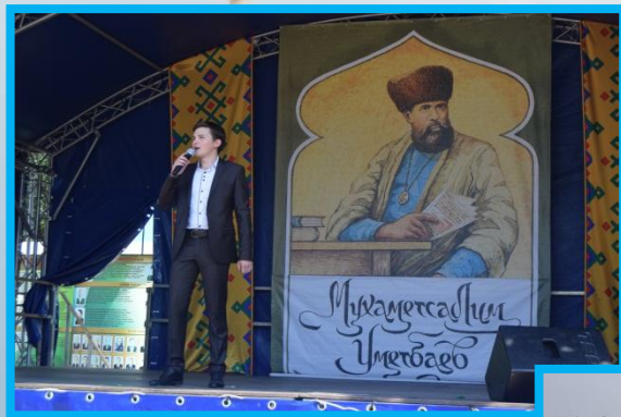
«Республиканский литературно – фольклорный праздник «В гостях у Мухаметсалима Уметбаева. Литературные прогулки с классиками» 2016г.