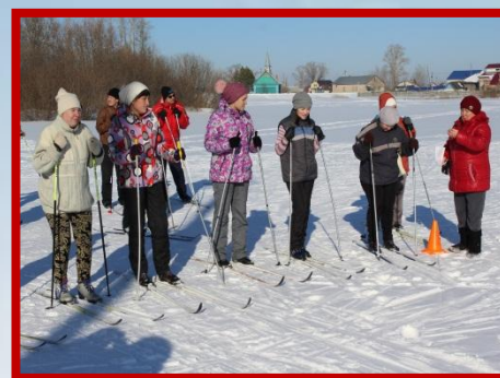
Спортивные соревнования «Мы Семья»