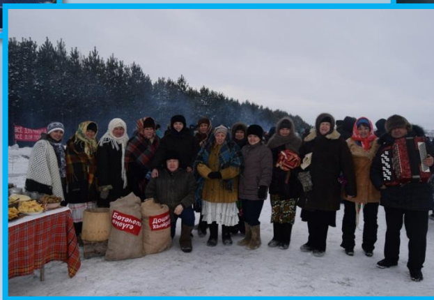
Военно – историческая реконструкция боя 112-й Башкирской кавалерийской дивизии под командованием генерал – майора М.М.Шаймуратова, посвящённая 75- летию формирования легендарной дивизии, в рамках Республиканского фестиваля «России славные сыны» 2016г.