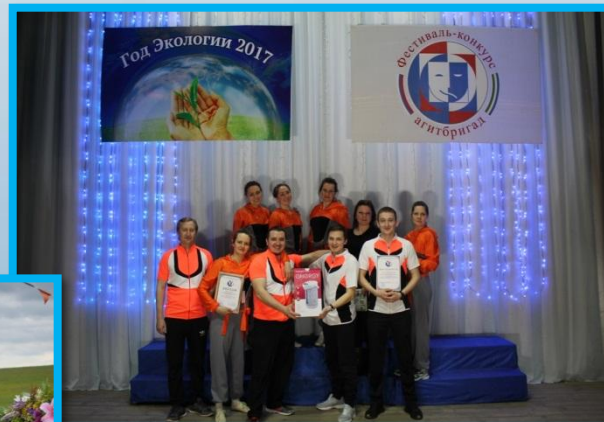
III Открытый фестиваль конкурс агитбригад и агитационно- художественных театров «Пропаганда.ру» 2017г.