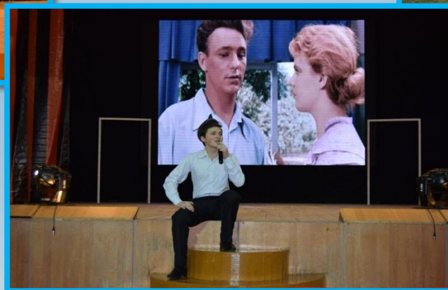
Театрализованное представление «Легендой овеванные имена», в рамках Республиканского фестиваля «России славные сыны» 2016г.