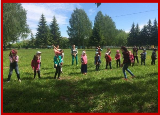
Конкурсно-игровая программа, посвященная Международному Дню защиты детей