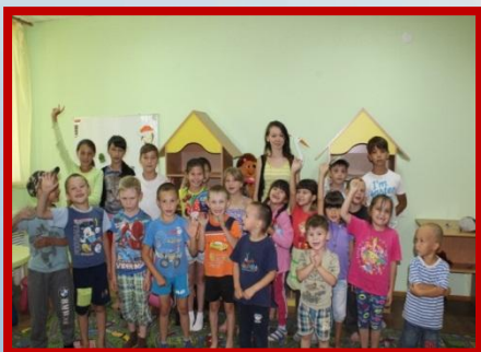
Конкурсно-развлекательная программа для детей «Хочу все знать»