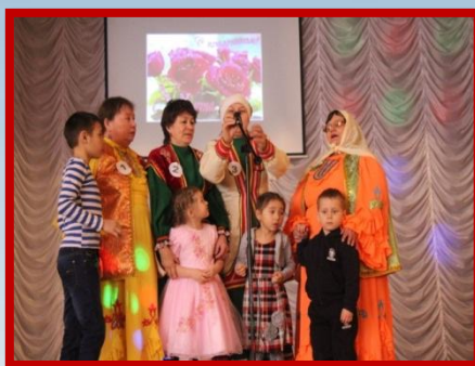
Конкурсно-развлекательная программа «А ну-ка, бабушки»