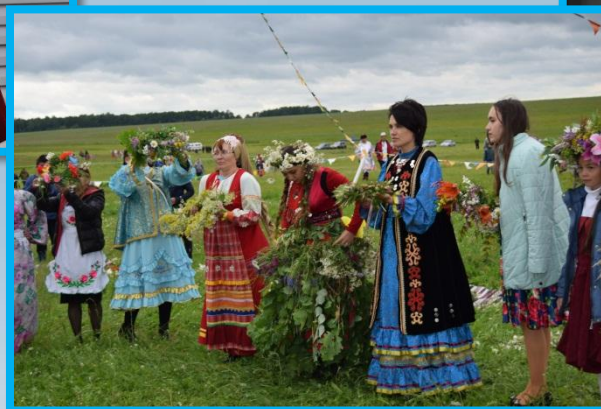
Республиканский праздник сенокоса «Звени, коса» 2017г.