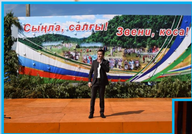
Республиканский фольклорный праздник сенокоса «Звени коса» 2016г.