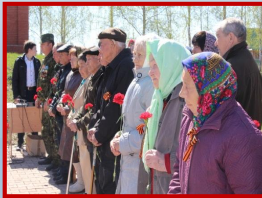
Торжественное мероприятие, посвященное 72-годовщине Победы Великой Отечественной войне