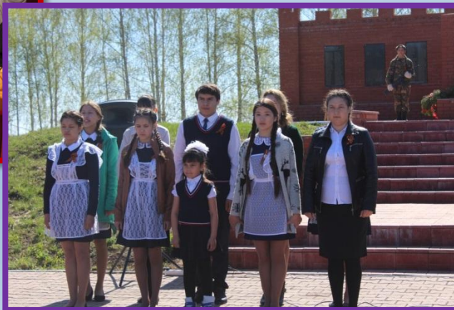
Детский вокальный ансамбль «Вдохновение»