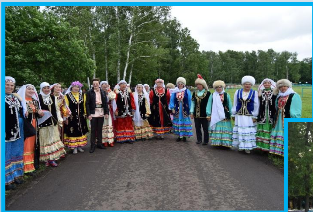
Народный праздник «Сабантуй» 2017г.