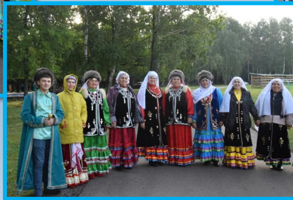
Национальный праздник «Театральный йыйын», в рамках VI Международного фестиваля тюркоязычных театров «Туганлык» 2017г.