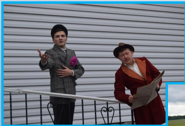
27-й Международный Аксаковский праздник 2017г.