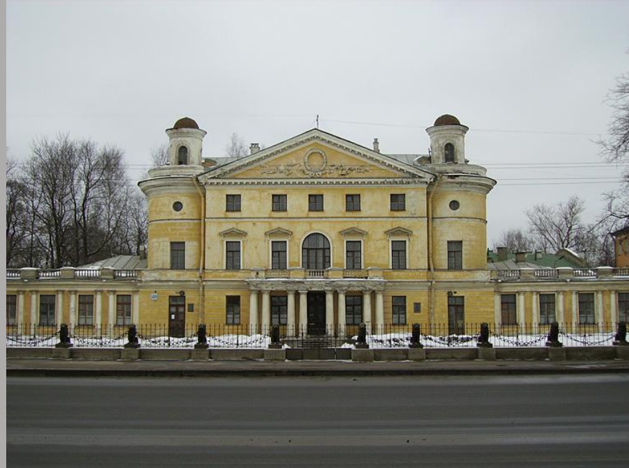
Свердловская наб., 40

Предположительно строительство усадьбы начал Баженов Василий Иванович, а завершил 1783-1784 - Джакомо Кваренги, при участии Николая Александровича Львова.