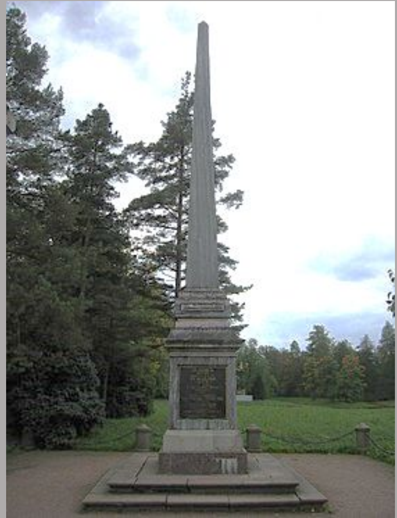
Кагульский обелиск — установлен в парке Большого Екатерининского дворца (г. Пушкин) по проекту архитектора Антонио Ринальди в 1771 году — в честь победы в Кагульском сражении.

Садятся призраки героев У посвященных им столпов, Глядите: вот герой, стеснитель ратных строев, Перун кагульских берегов. Вот, вот могучий вождь полунощного флага, Пред кем морей пожар и плавал и летал. («Воспоминания в Царском селе»)