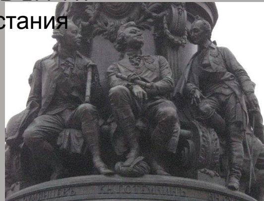
Потёмкин (в центре) на постаменте памятника Екатерине II в Санкт-Петербурге