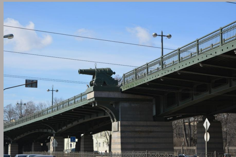
Ушаковский мост в Санкт-Петербурге

В ходе русско-турецкой войны 1787—1791 годов Ф. Ф. Ушаков сделал серьёзный вклад в развитие тактики парусного флота. Опираясь на совокупность принципов подготовки сил флота и военного искусства, используя накопленный тактический опыт, Ф. Ф. Ушаков перестраивал эскадру в боевой порядок уже при непосредственном сближении с противником, минимизируя время тактического развёртывания. Ушаков смело ставил свой корабль передовым и занимал при этом опасные положения, поощряя собственным мужеством своих командиров. Его отличали быстрая оценка боевой обстановки, точный расчёт всех факторов успеха и решительная атака. В связи с этим, Ф. Ф. Ушакова можно считать основателем русской тактической школы в военном деле.