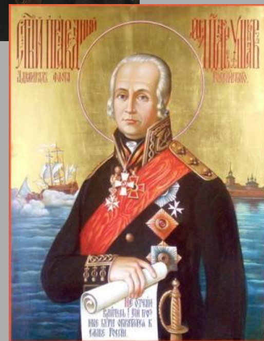
Икона Святой праведный воин Феодор Ушаков