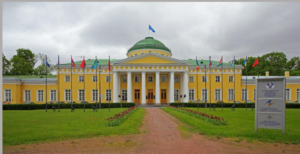
Таврический дворец и сад Потемкина в Санкт-Петербурге