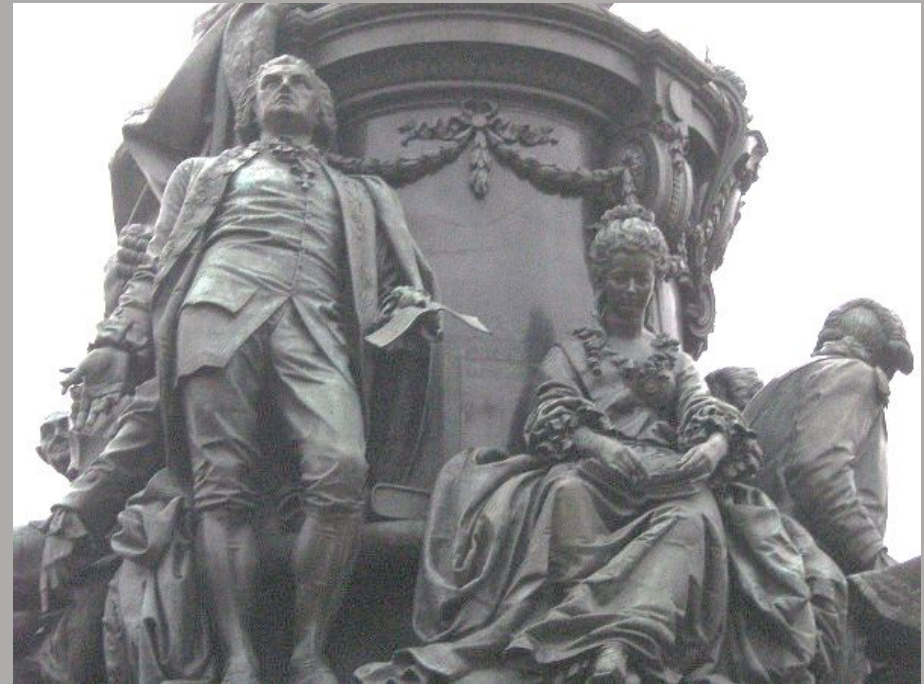
Фрагмент памятника Екатерине II в Санкт-Петербурге. Г. Р. Державин и Е. Р. Дашкова

При Академии были организованы публичные лекции, имевшие большой успех и привлекавшие много слушателей. Дашкова увеличила число студентов — стипендиатов Академии с 17 до 50, воспитанников Академии художеств — с 21 до 40.