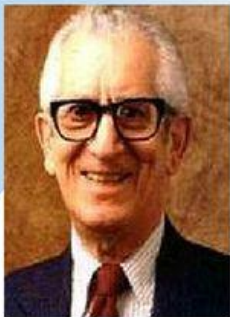
Бенджамин Блум (1913-1999 жж.)

Бенджамин Блум-америкалық оқыту әдістемесінің психологі, Блум таксономиясының авторы. Пенсильванияда Ленсфорд қаласында туылған. 1935 жылы Пенсильван университетін бакалавр және магистр деңгейлерімен бітірген, 1942 ж Чикаго университетінде докторлық деңгейін қорғады. 1956 жылы «Блум таксономиясын» ұсынды.