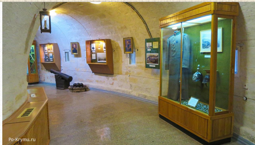
Севастополь шинель Томского полка Малахов курган