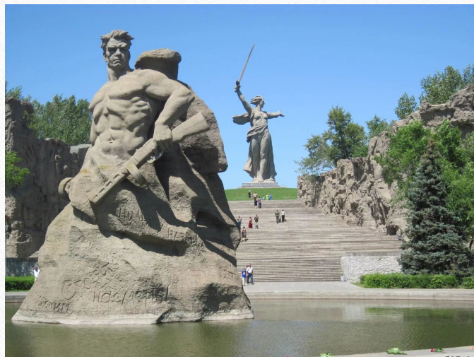
Волгоград, Мамаев курган