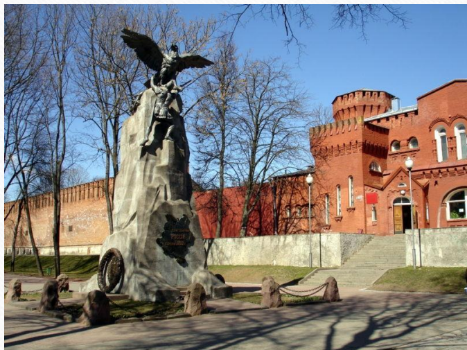
Смоленск памятник войне 1812