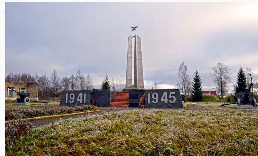
Мемориал памяти 166-й Томской дивизии в деревне Верховье Смоленск