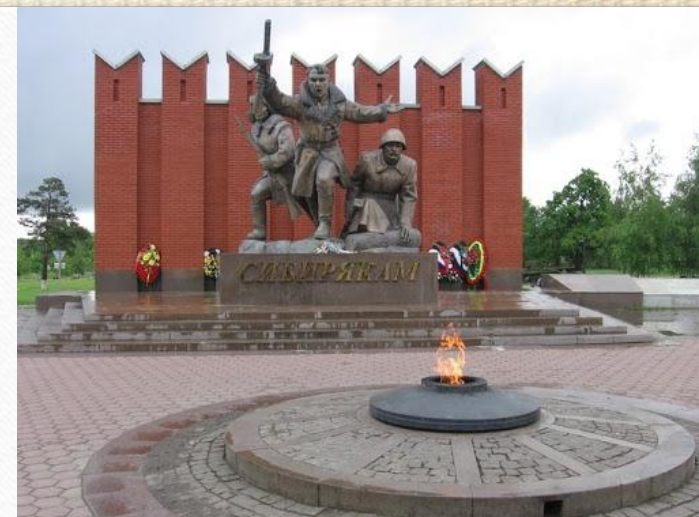
Памятник Сибирякам 1941-1942