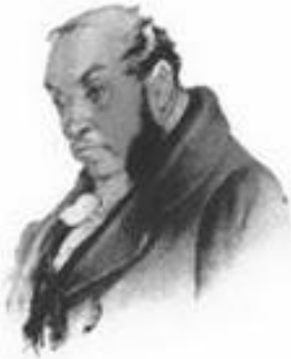
Амос Федорович Ляпкин-Тяпкин, судья.