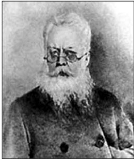
БОКЛЕВСКИЙ Пётр Михайлович 1816-1897