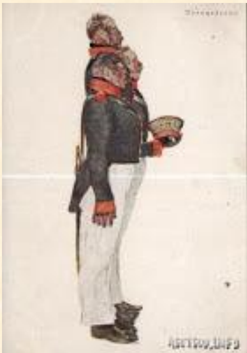
Квартальные Держиморда, Свистунов, Пуговицын