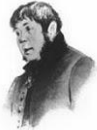
Иван Кузьмич Шпекин, почт- мейстер.