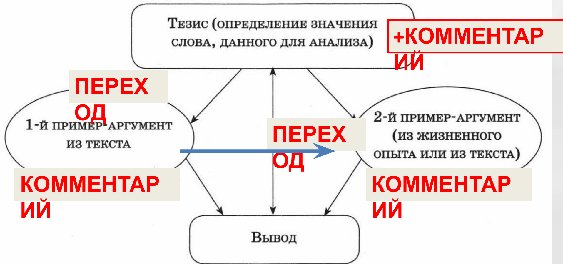
Схема сочинения-рассуждения 15.3

Все ваши мысли и аргументы сконцентрированы