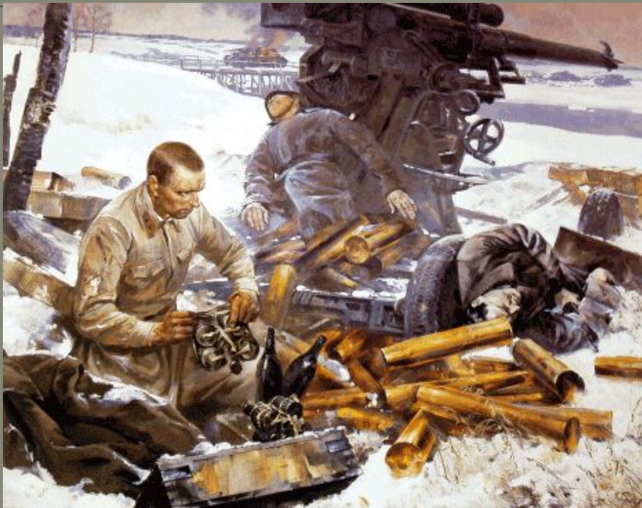
Иллюстрация к повести «Убиты под Москвой».