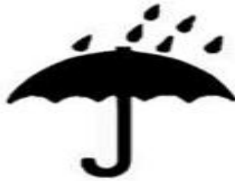
Беречь от влаги