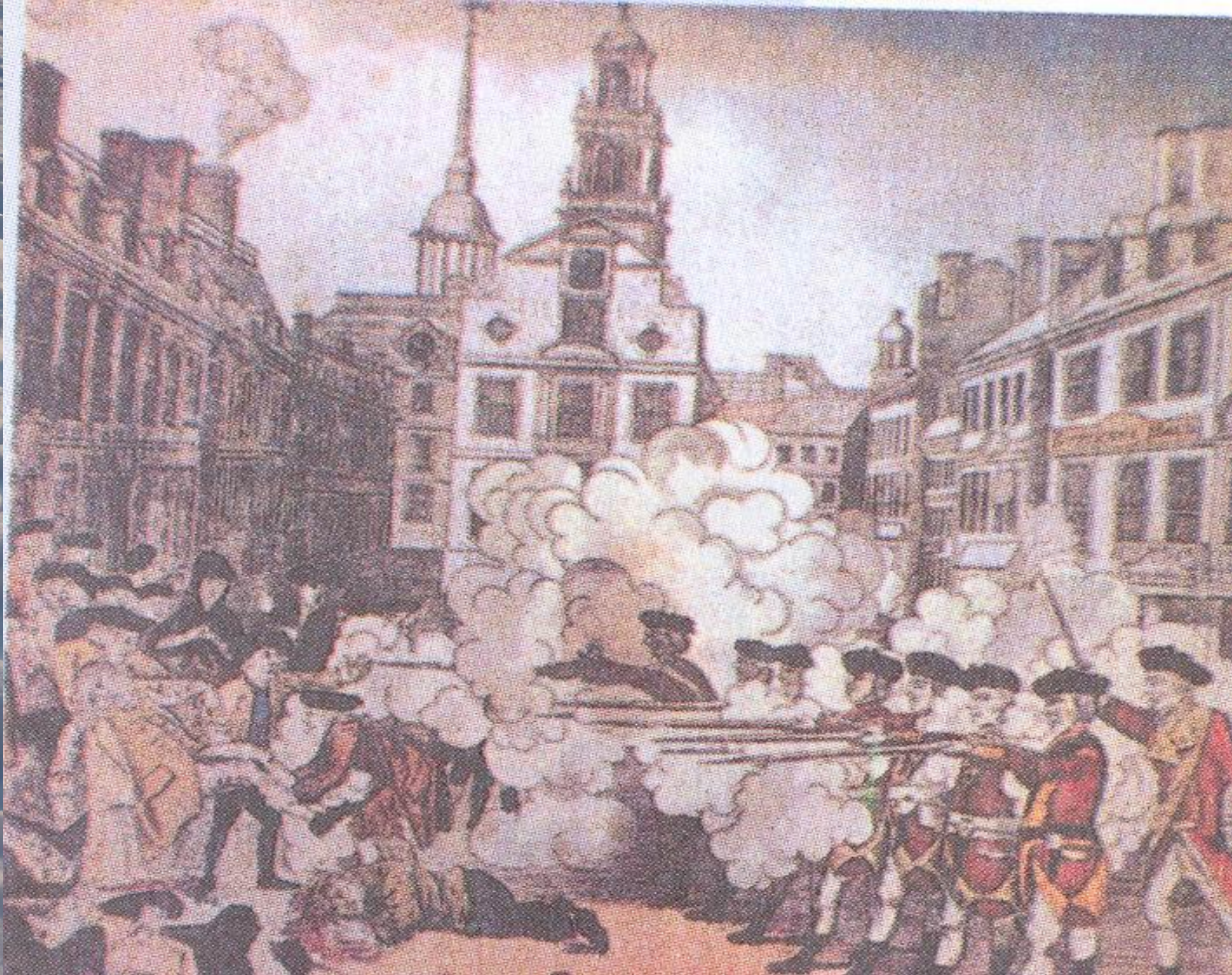
Бостонская бойня (1770)