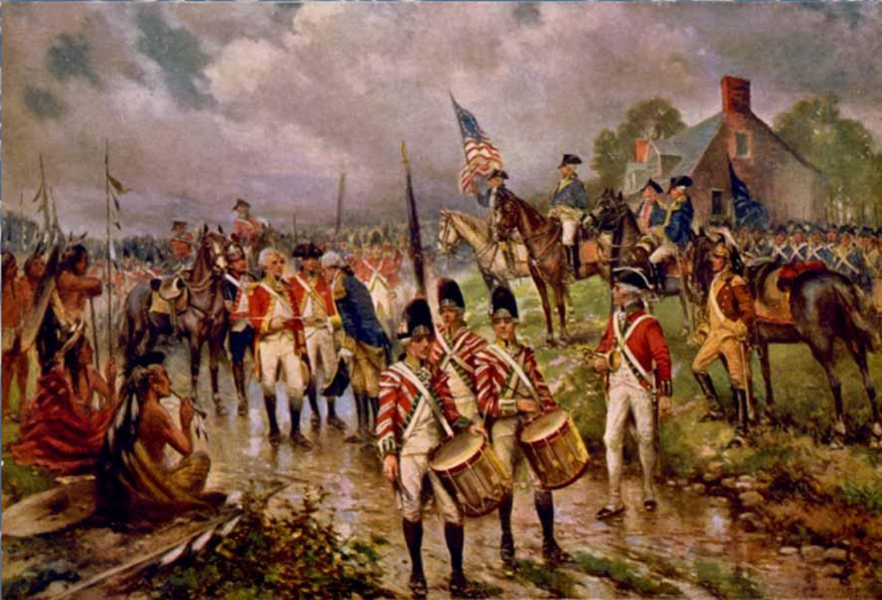
Битва при Саратоге. 1777 год