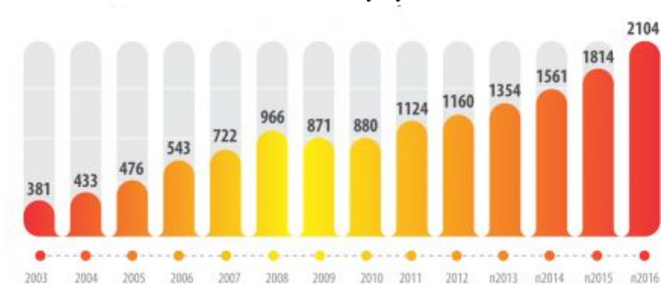
Показник ВВП на душу населення