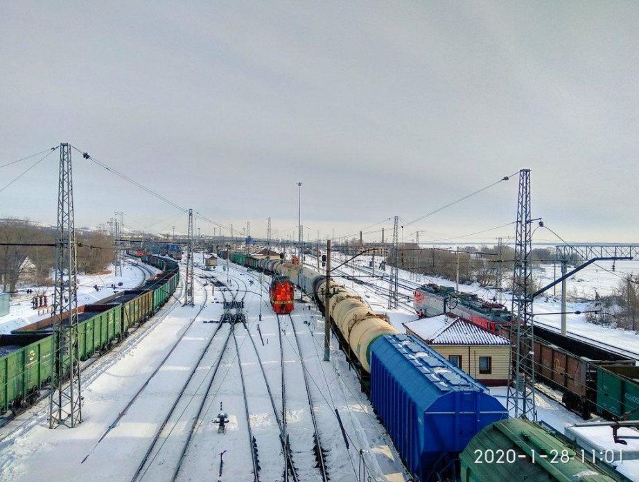
Станция Октябрьск состоит из 7 парков, включающих в себя:

приёмо-отправочный парк, сортировочный парк, приёмо-отправочный парк, для работы с местными вагонами парк, приёмо-отправочный парк, приёмо-отправочный парк, приёмо-отправочный парк. Сортировочная система, включающая в себя парки, расположена последовательно. Транзитные парки относительно сортировочной системе расположены параллельно.