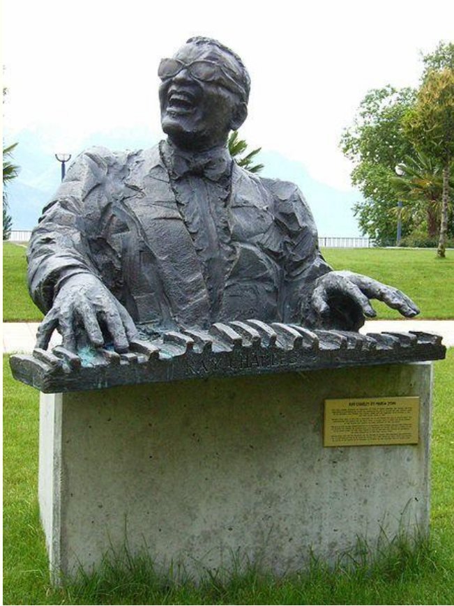
Памятник Чарльзу в Монтрё