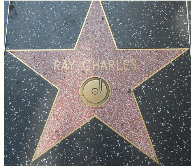
Звезда Рэя Чарльза на Голливудском бульваре в Лос- Анджелесе