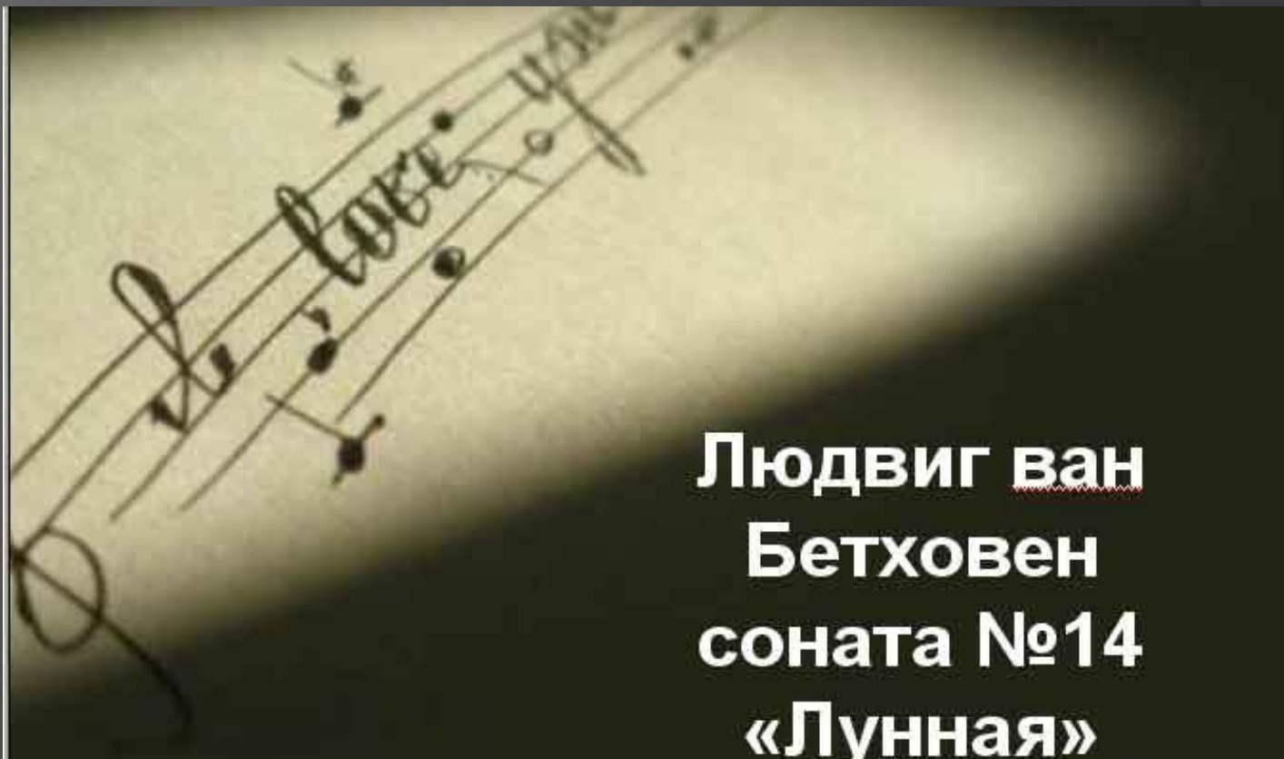
Людвиг ван Бетховен соната №14 «Лунная»

Его дебют как пианиста состоялся в 1795 году. К 1802 году Бетховен был известен как создатель 20 фортепианных сонат, в их числе «Патетическая» (1798 год), «Лунная» (№2 из двух «сонат-фантазий» 1801 год), шесть струнных квартетов, восемь сонат для скрипки и фортепиано, множество камерно-ансамблевых сочинений.