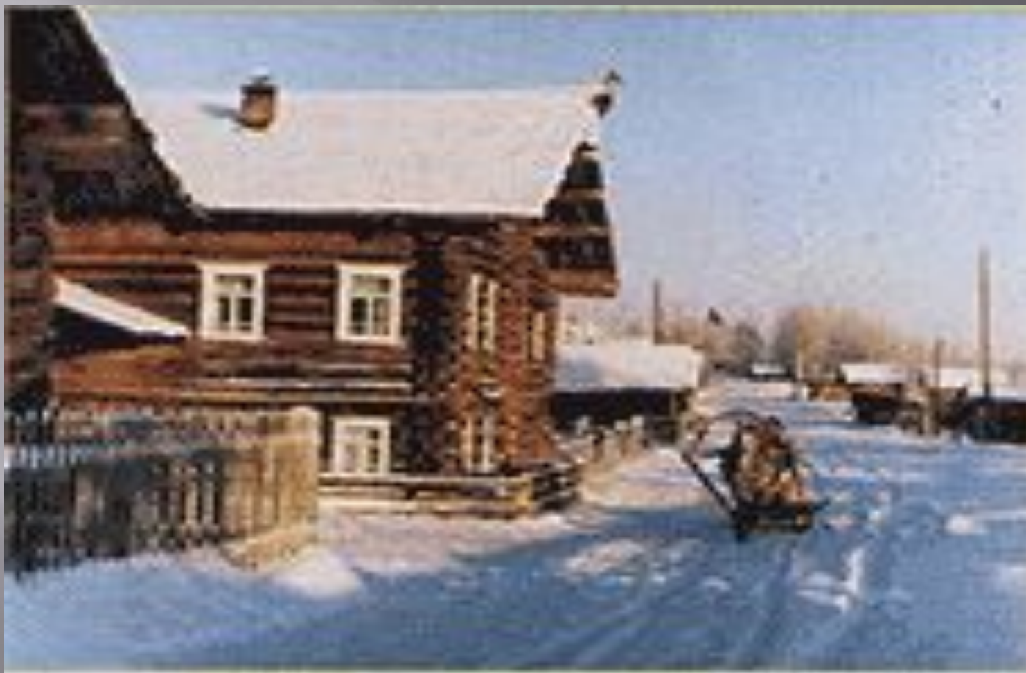
Веркольская улица зимой.