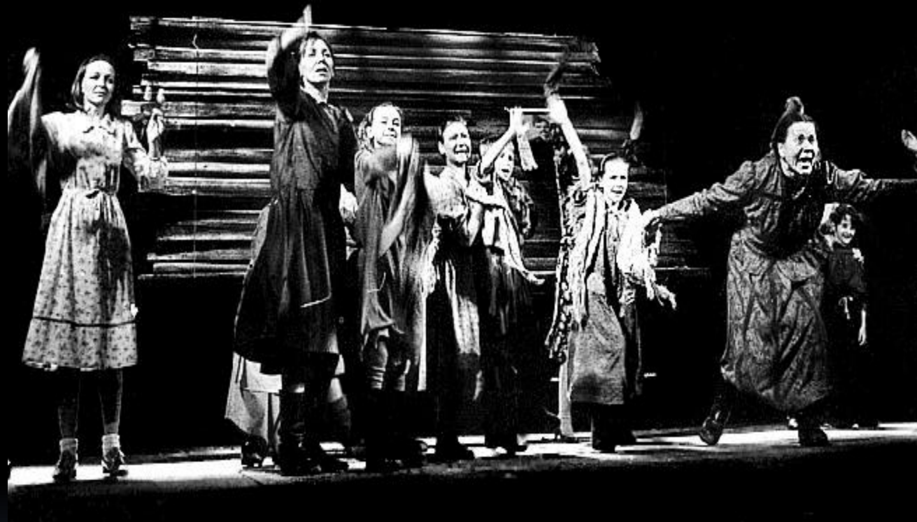
БРАТЯ И СЕСТРЫ (сцена из спектакля)