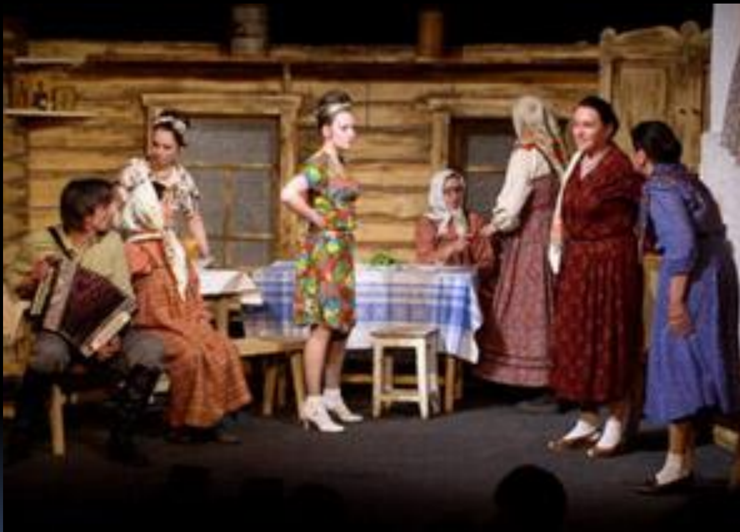
Спектакль «БАБИЛЕЙ» по рассказам Ф. Абрамова