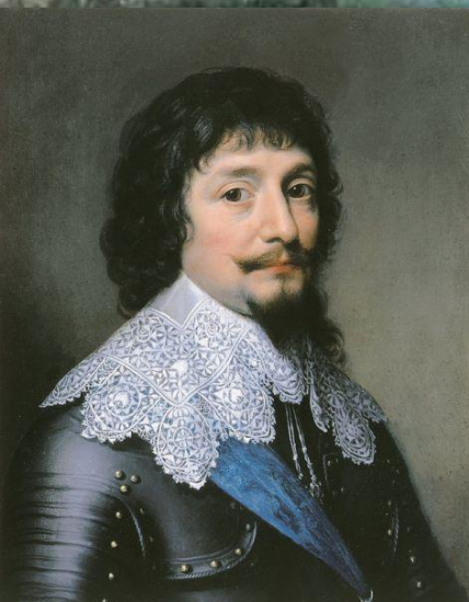
Фридрих Пфальцский, король Чехии