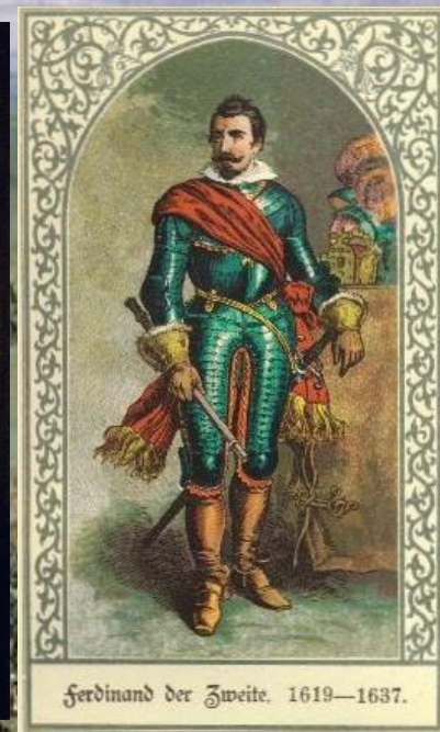
Фердинанд Штирийский, король Чехии