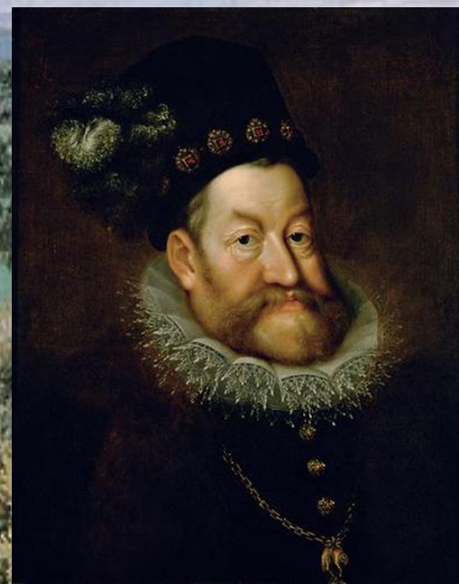
Рудольф II, император Священной Римской империи