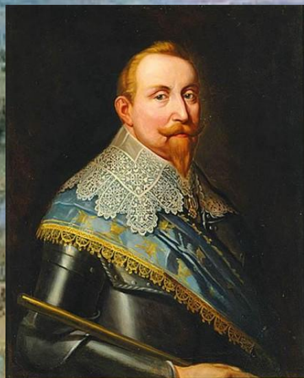
Густав- Адольф, король Швеции