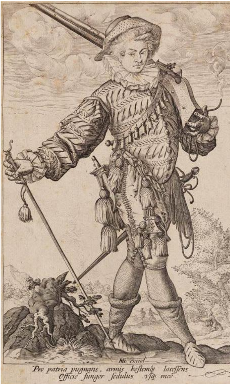
166. Excid. Pro patria pugnavit, armis hostemq; laessens Officio fungor sedulus vsq; meo.