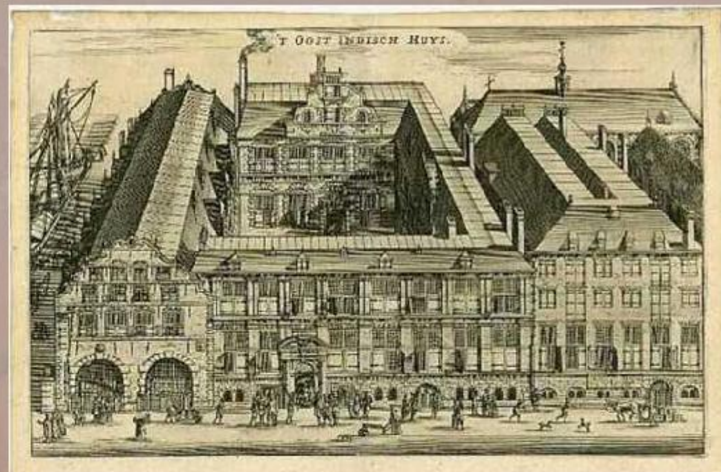
Ост-Индская торговая компания

МОНОПОЛИЯ – исключительное право на производство или продажу чего-либо