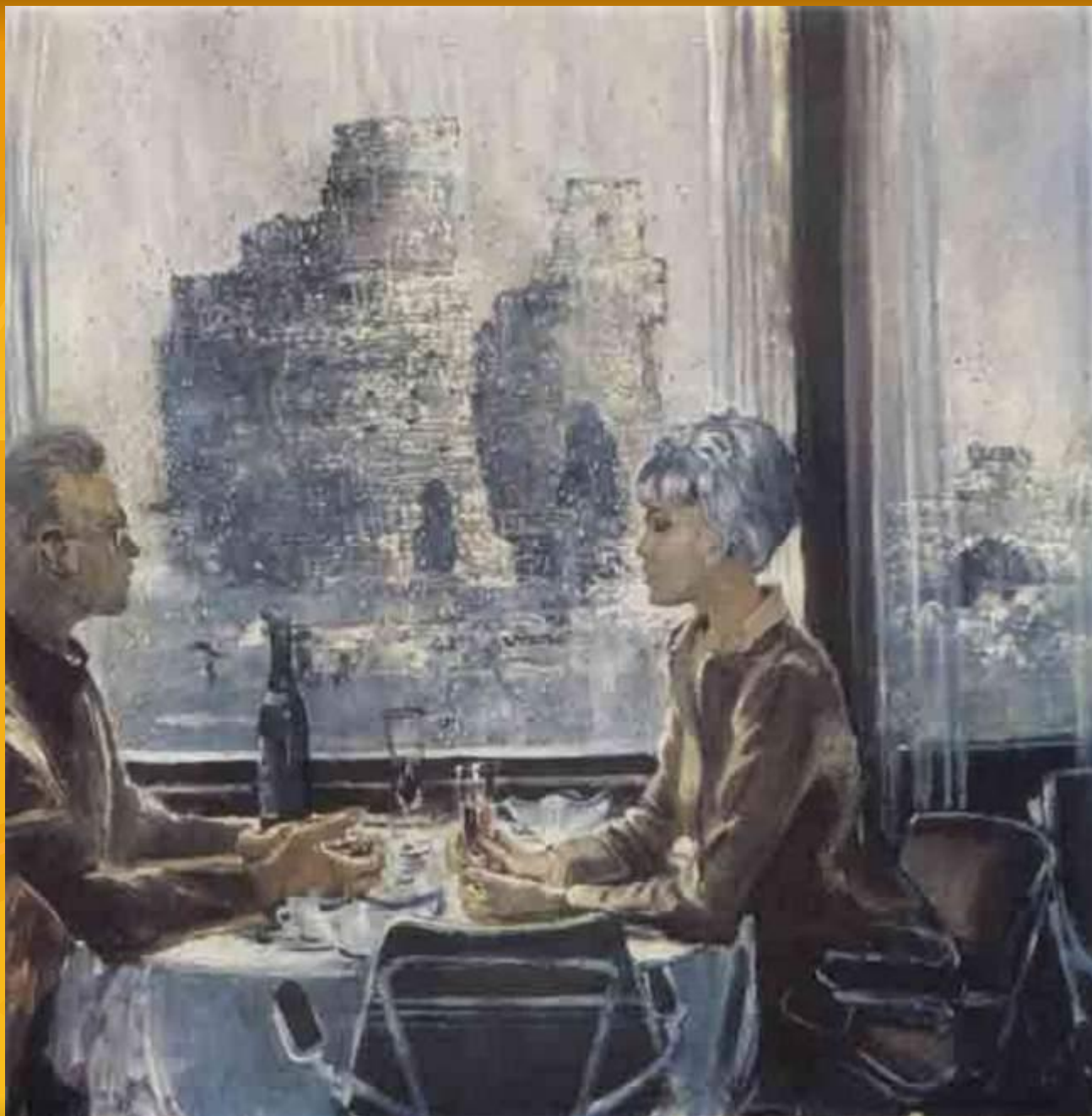
Калининград. Дождь 1968