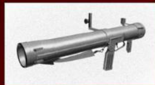
Современный реактивный пехотный огнемет РПО-А