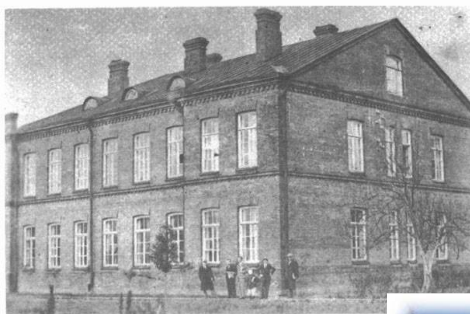
Budynek Seminarium Nauczycielskiego w Szczuczynie Nowogródzkim, stan przed 193

В 1903 году в здании, где впоследствии разместилась гимназия, действовала духовная семинария. С 1933 по 1939 год – польская классическая гимназия.