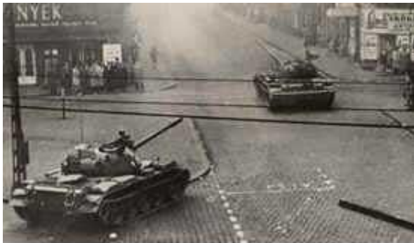
Советские танки Т-54 в Будапеште