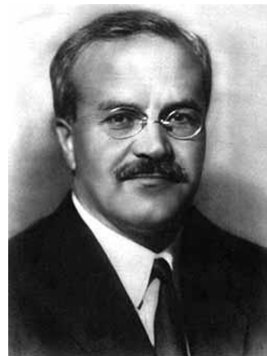
министр иностраннх дел СССР в 1939—1949, 1953—1956 годах

Принцип мирного сосуществования государств с различным общественным строем отрицался.