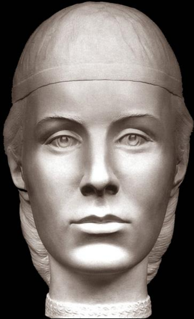
Елена Глинская Реконструкция по черепу, С. Никитин, 1999 г.