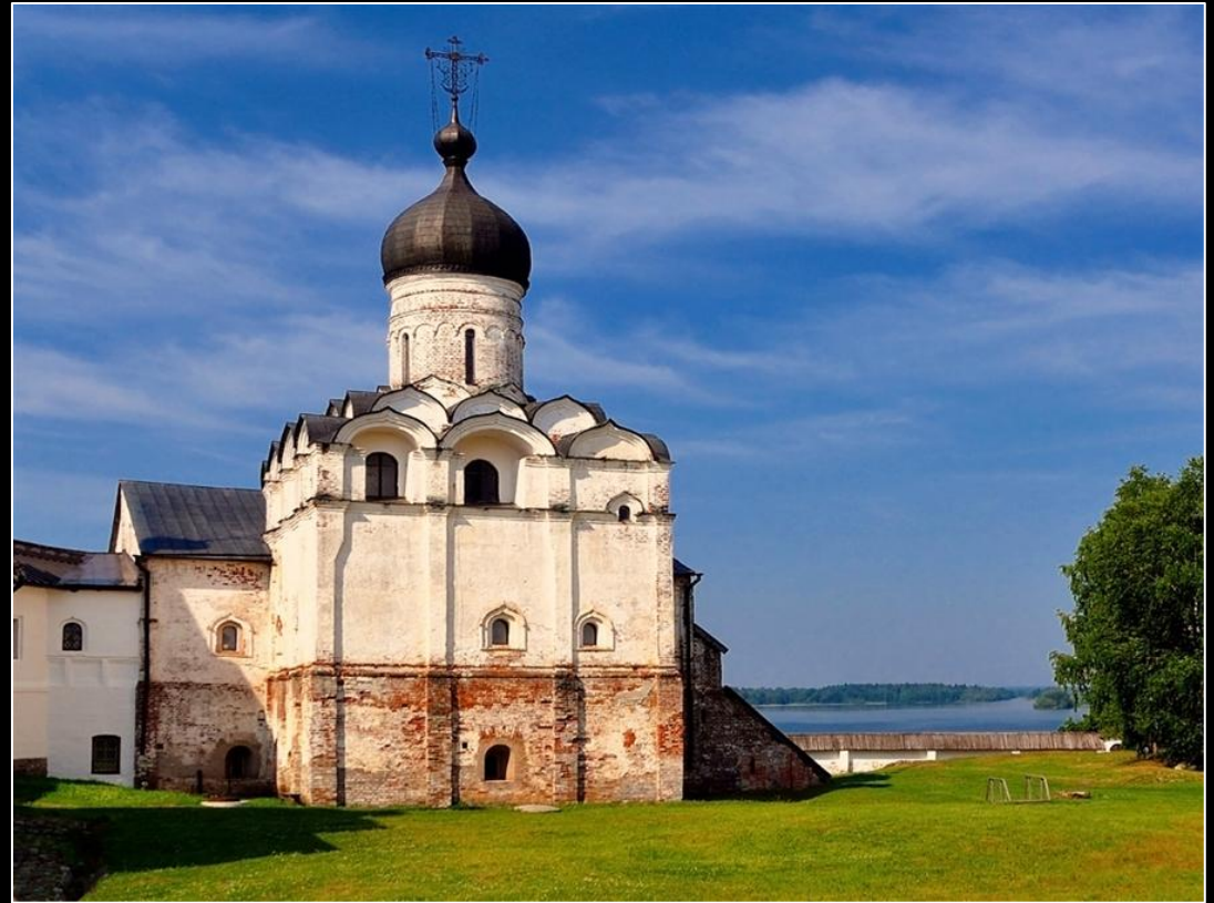
Церковь Благовещения в Ферапонтовом монастыре