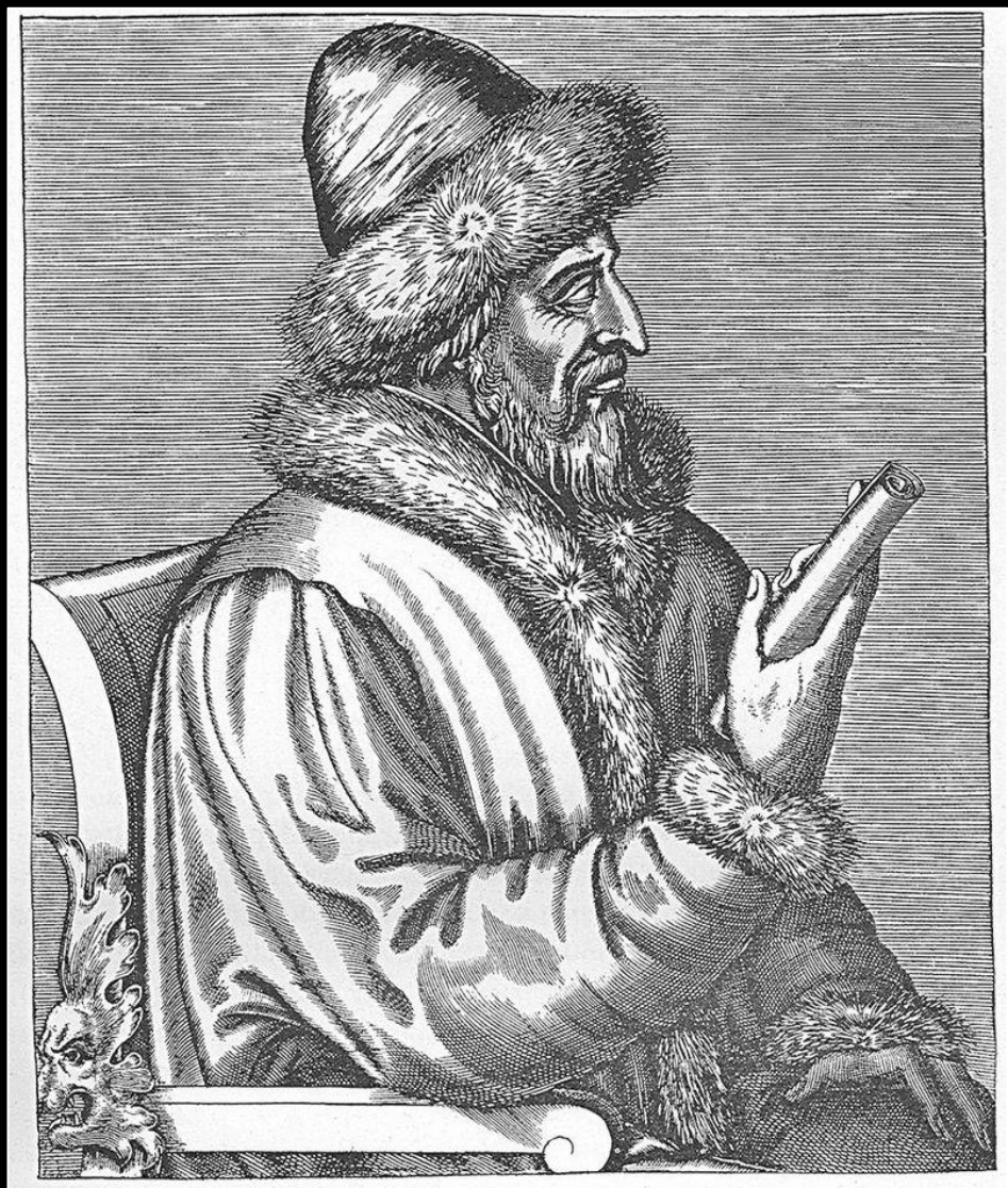
Василий III на французской гравюре Андре Теве, 1586