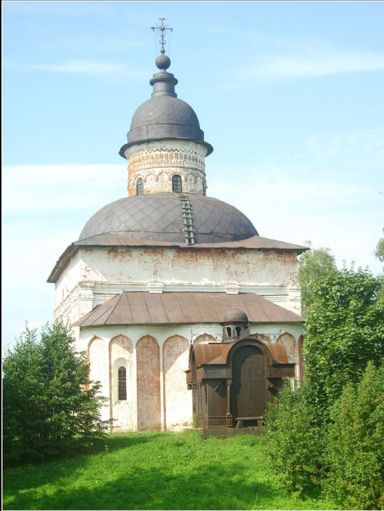
Церковь Иоанна Предтечи в Кирилло-Белозерском монастыре