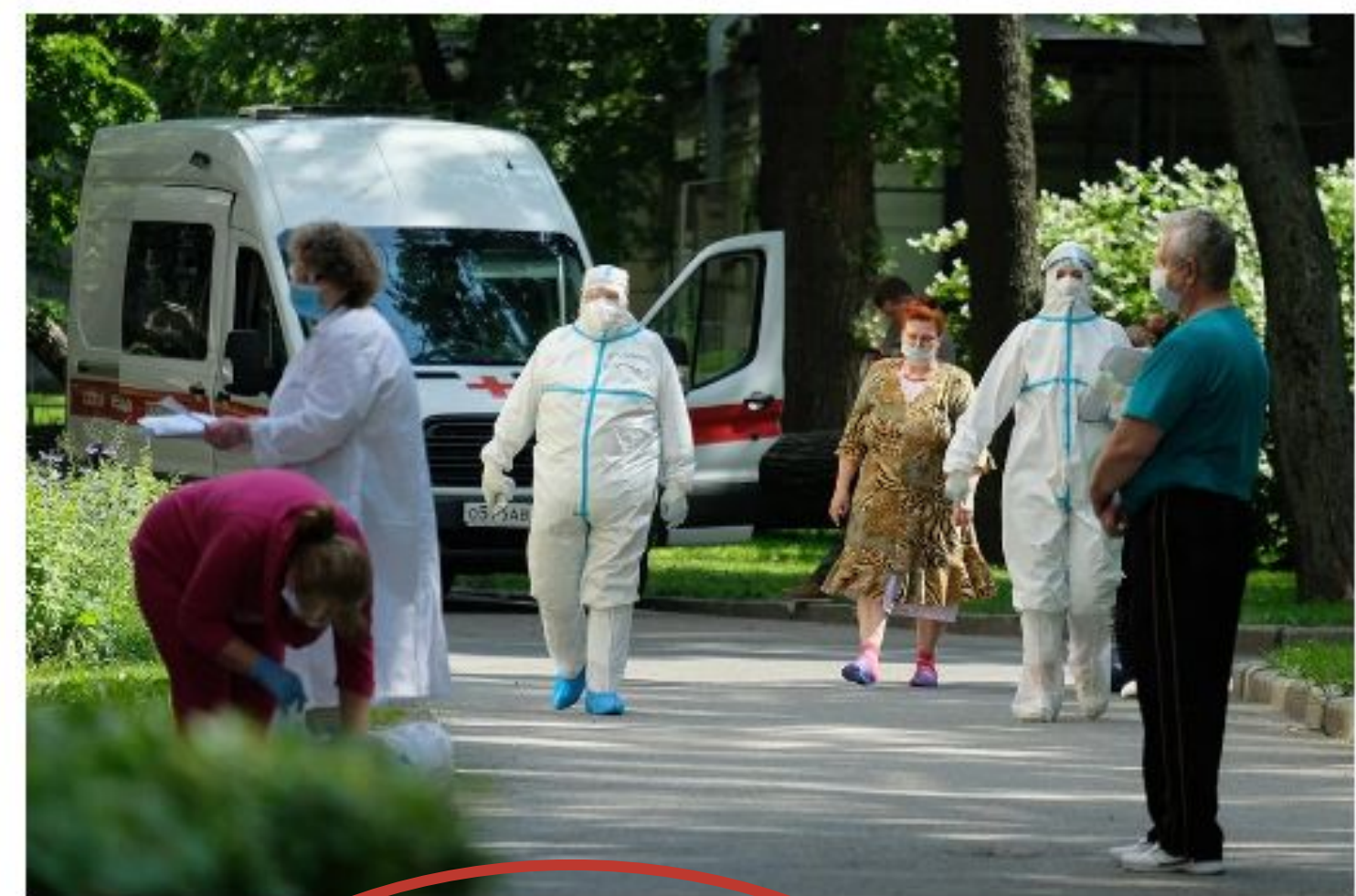
К прежней жизни мы уже не вернемся