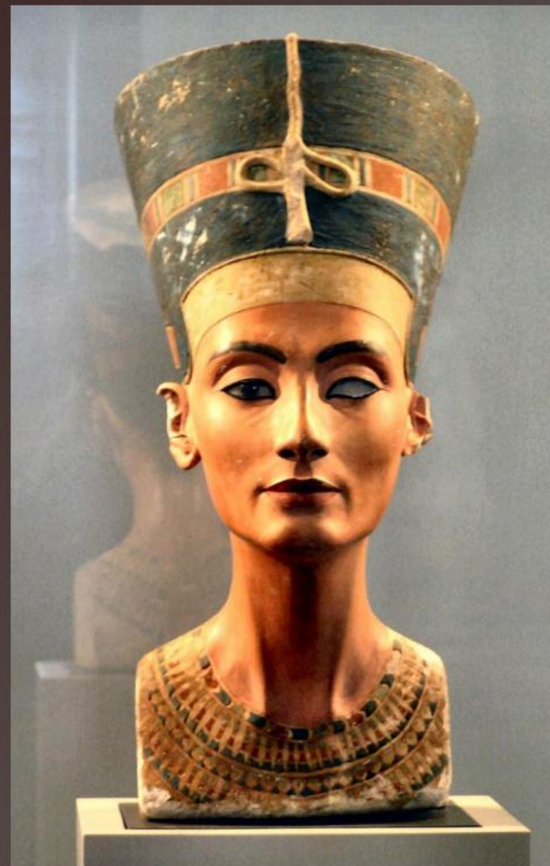
Бюст Нефертити ок. 1351—1334 до н. э.

Искусство портрета родилось примерно несколько тысячелетий назад. Сохранились древние скульптурные портреты Древнего Египта, например портрет Нефертити. Созданный приблизительно в 1351—1334 годах до нашей эры. Основа бюста выполнена из известняка и покрыта гипсо-ангидритовой смесью, окрашенной в шесть цветов. Левая глазница является пустой, мнения специалистов относительно причин отсутствия левого глаза значительно расходятся. Скульптура представляет собой идеализированное изображение царицы, её лицо абсолютно симметрично. По мнению советского египтолога Милицы Матье, в бюсте Нефертити «особенно поразительно сочетание строгого, скупого отбора черт, необходимых для выразительности портрета, с той мягкостью трактовки, которая и придаёт всему произведению характер подлинной жизненности» Матье М. Во времена Нефертити. — Л., М.: Искусство, 1965.