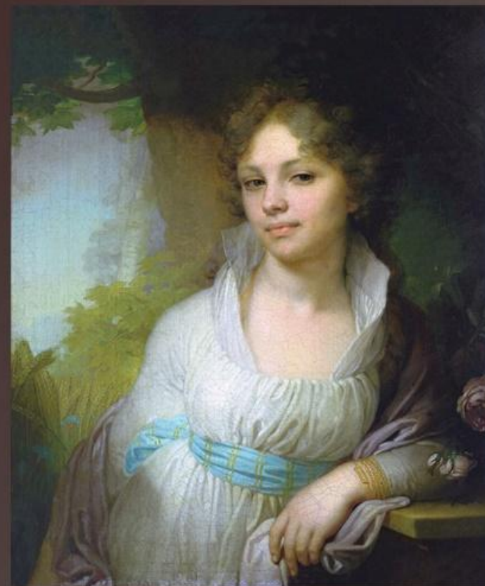
Владимир Лукич Боровиковский камерный портрет Марии Лопухиной 1797 г.