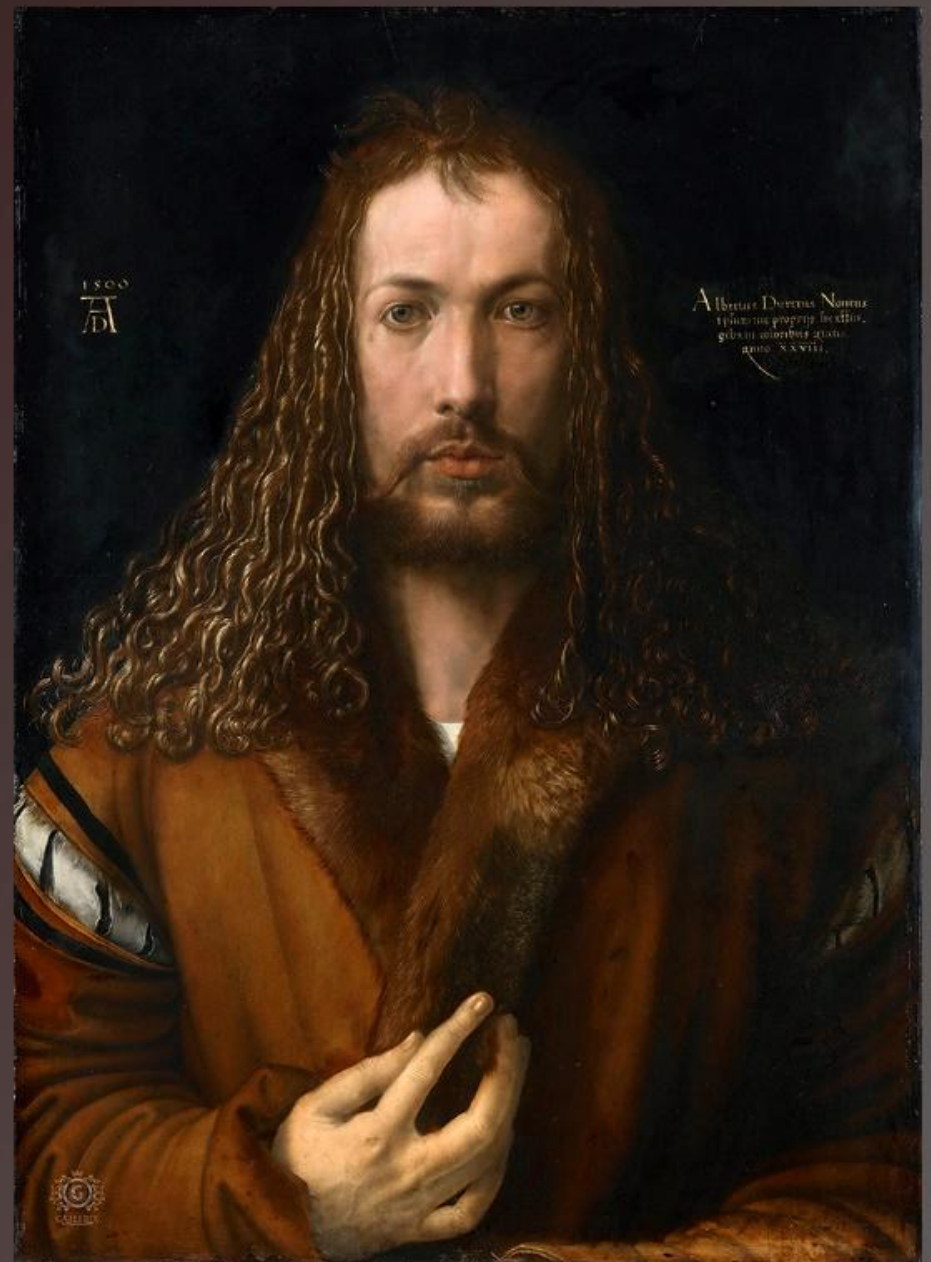
Альбрехт Дюрер: Автопортрет 1500 г.

Без духовного совершенствования человека никакие социальные блага, никакие достижения материально-технического прогресса не принесут людям полноты подлинно человеческого существования.