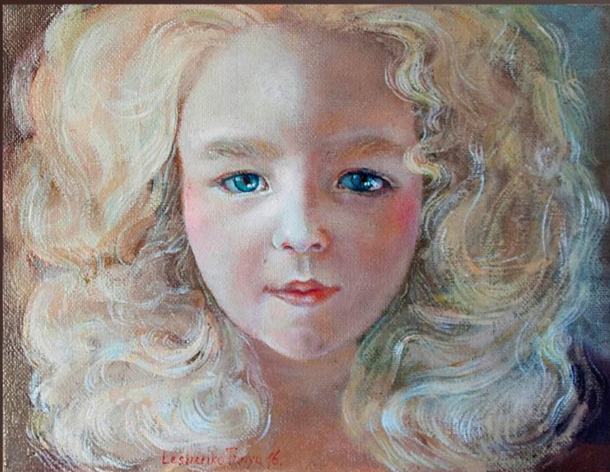
Портрет дочери 2016