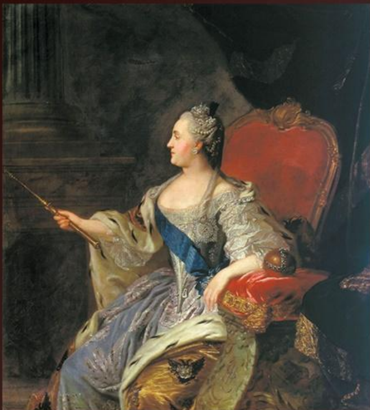
Рокотов Федор Степанович парадный портрет Екатерины Великой 1763 г

К концу XVIII в. Русские живописцы достигли совершенного мастерства. Портреты было принято делить на парадные и камерные .