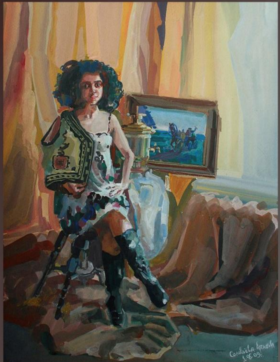
Художник: Лещенко Т.А 2009. (упоминается старый псевдоним)

Само слово «портрет» произошло от латинского. Его можно перевести как «извлечение сущности» , т.е. выявление внутреннего содержания.