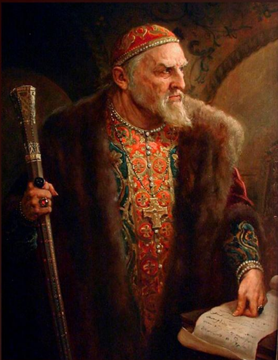
Царь Иван Грозный 2009