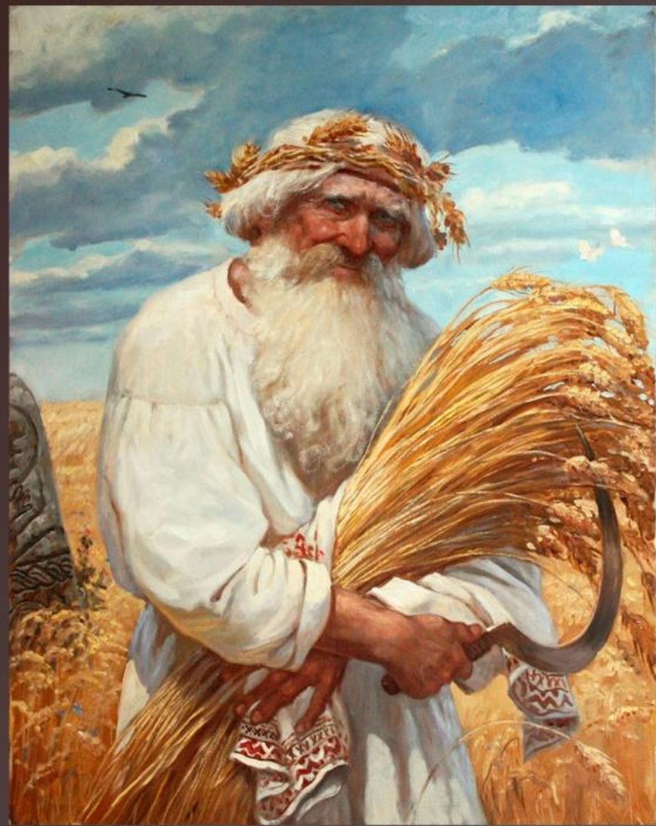
Белун, Древнеславянский Бог , помощник в жатве 2014