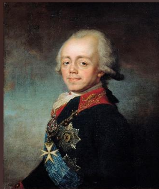
Степан Семёнович Шукин. Портрет императора Павла I

Не меньшее значение имел Камерный портрет , в котором большое внимание уделялось индивидуальным особенностям человека. Его лицо обычно приближено к зрителю, доверительно раскрывая внутренний мир героя. В это время особенно ценилось очень сложное и тонкое умение передавать едва уловимые трепетные оттенки переживаний