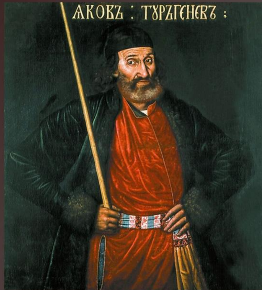
Неизвестный художник Портрет Якова Федоровича Тургенева, жильца рейтарского строя Не позднее 1695г,

Тургенев одет в алый шелковый кафтан, подпоясанный узорным кушаком с желтым свисающим концом, и темно-зеленую бархатную шубу, подбитую темным мехом. Голова повязана темно-зеленой лентой.