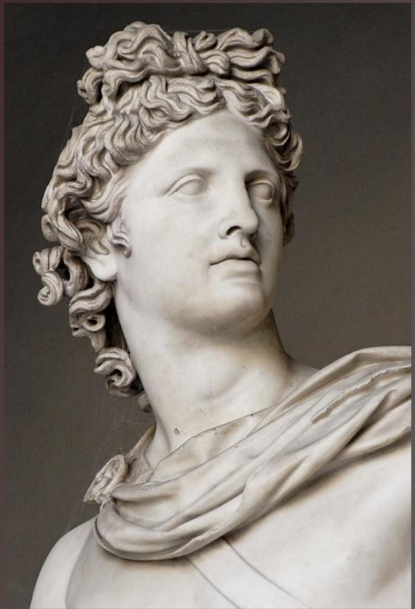
Аполлон Бельведерский. ок. 330—320 до н. э. Музей Пия-Климента, Ватикан

Зачастую этот образ считается в искусстве образцом классической формы. Во многих художественных школах а так же высших художественных учебных заведениях используют статую для постановки рисунка и изучения идеальных черт.