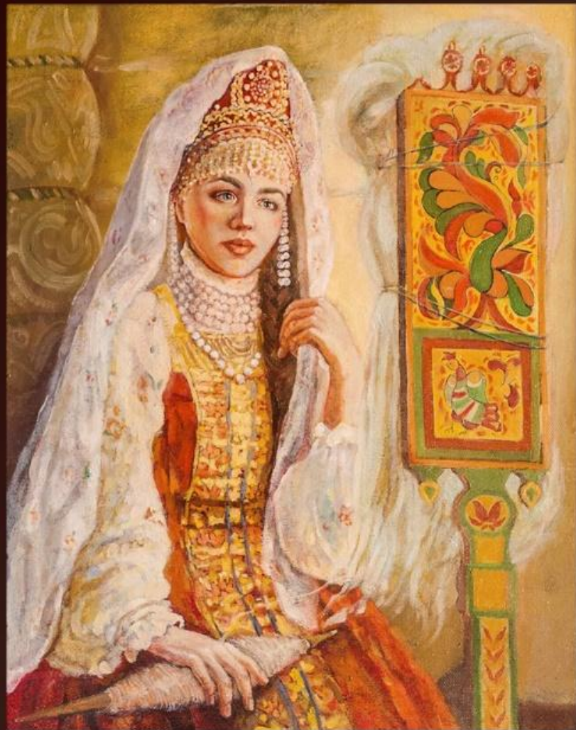
«Кого люблю того дарю», автопортрет 2011-2016