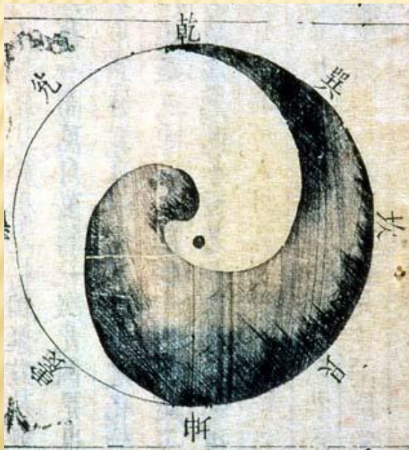
Графический символ инь-ян

Взятые отдельно друг от друга, две части круга неполны, но вместе они образуют гармоничное единство.