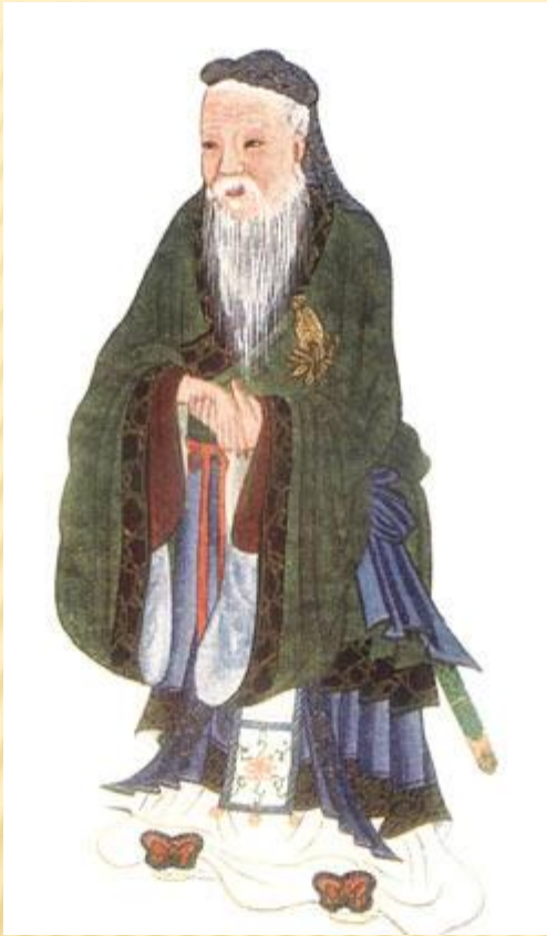
Конфуций. рисунок из книги «Мифы и легенды Китая»

Золотое правило этики: «Не делай человеку того, чего не желаешь себе».