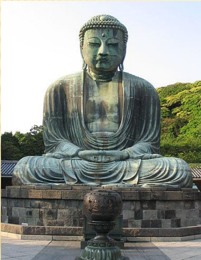
Статуя Будды в Японии

Будда – это не Бог, а учитель. Сиддхартха Гаутама – не первый и не последний Будда, он лишь один из череды Будд с далекого прошлого до далекого будущего.