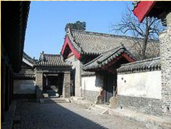
Дома потомков Конфуция в его родном городе Цюйфу

Синь (信) — искренность, «доброе намерение», непринуждённость и добросовестность. Эти качества предупреждают лицемерие.