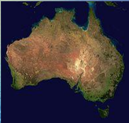
Снимок Австралии из космоса

Австралийский союз — государство Австралийский союз — государство в Южном полушарии площадью 7 741 220 км 2 .