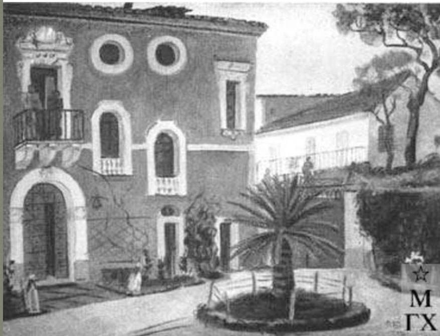
Дом, где жил А.М. Горький в Сорренто

16 октября 1921 года Горький уезжает за границу из-за обострения туберкулеза. Лечится он в Германии и Чехии. Позже, в 1924 году переехал в Италию.