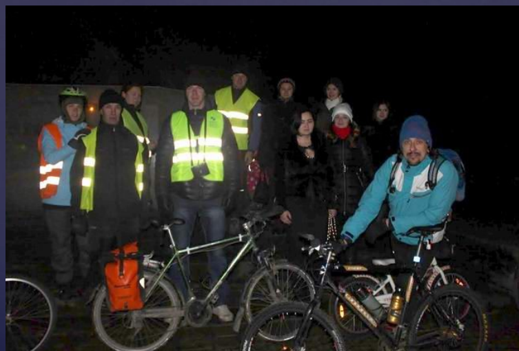
2016 г. ( Экскурсия( Велопробег) : «Калининград 2016г»