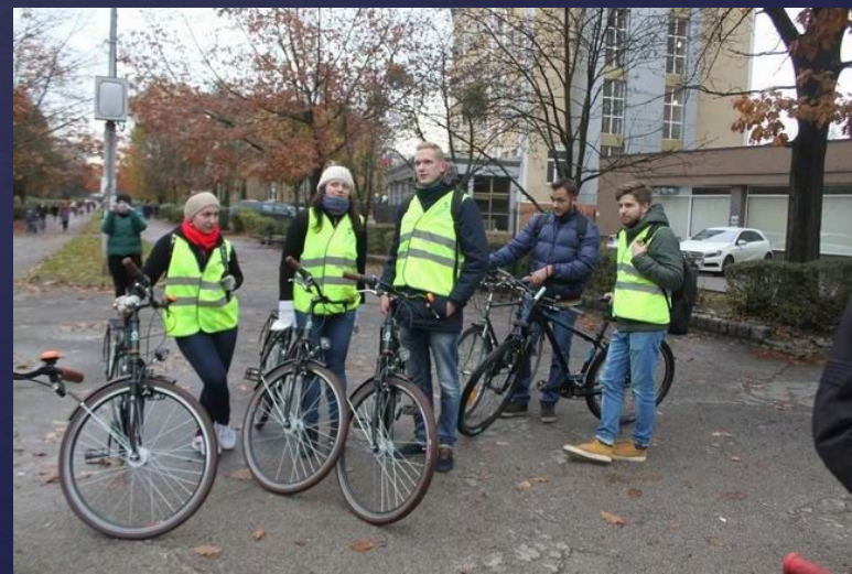
2016 г. Экскурсия( Велопробег) : « Их имена в названиях улиц»