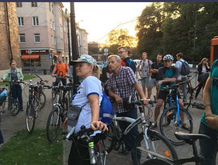
У гостиницы : « Москва»