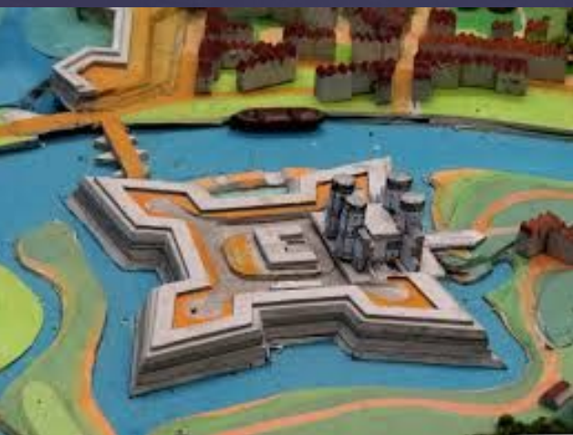
Макет Крепости Фридрихсбург, где Петр учился артиллерийскому делу.

За мостом крайний дом слева, принадлежащий в то время бургомистру Кнайпхоффа Христофору Негеляйну. В этом доме останавливался русский царь.