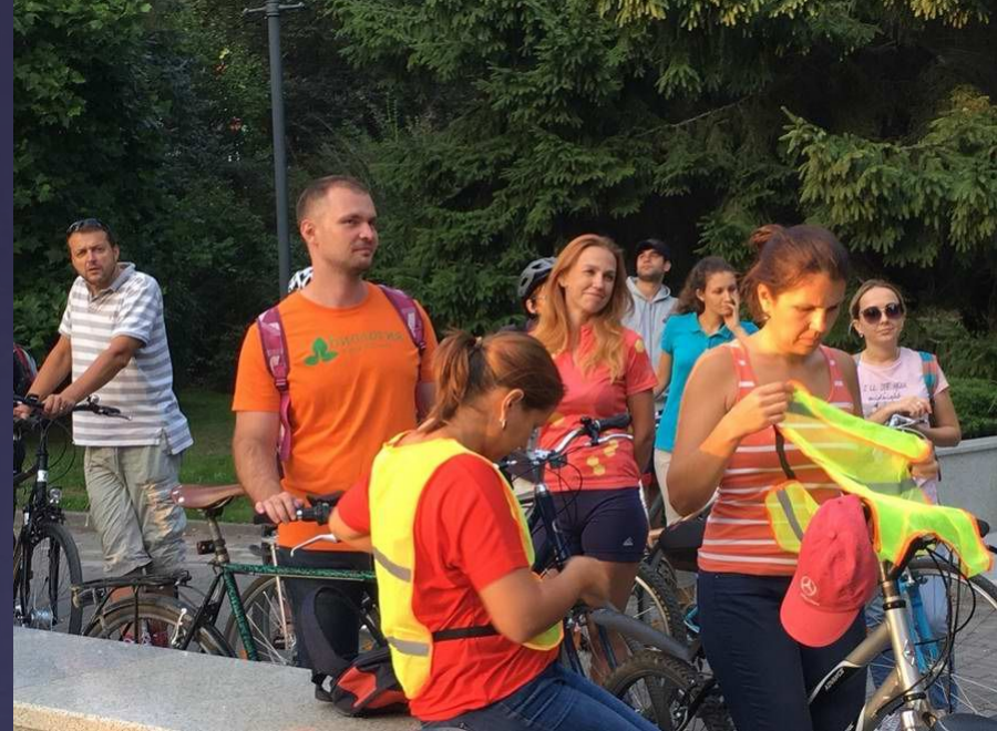
Готовимся к отъезду.