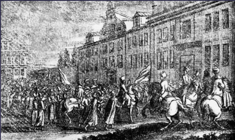
прибытие Великого посольства в Кенигсберг, 18 мая 1697 года.