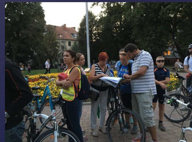
А нам очень интересно!