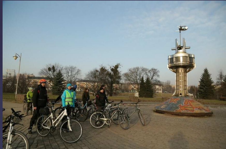
2017 г. Экскурсия( велопробег) : «Калининградское время»