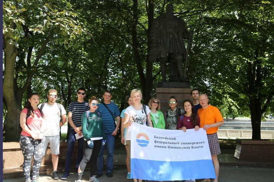
2018 г. Экскурсия( Велопробег): «История БФУ имени И.Канта»