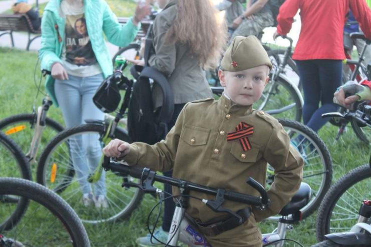
2018 г. Экскурсия( велопробег) : «Шел солдат на тот Берлин»