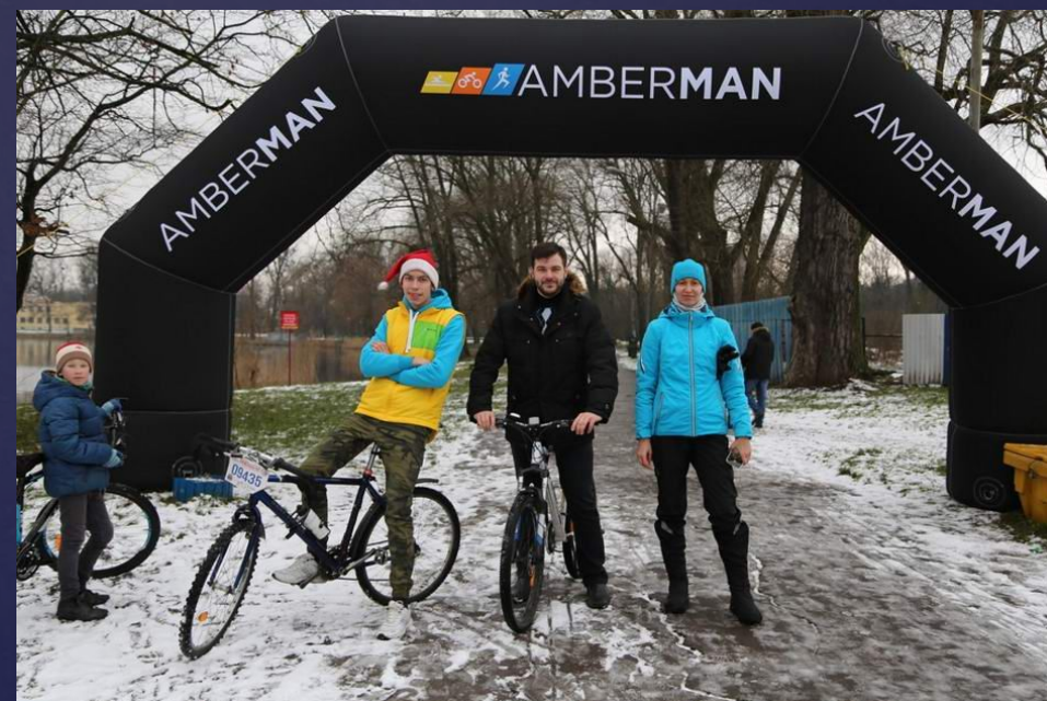
2017 г. Экскурсия( Велопробег): «Калининград 1947 г»