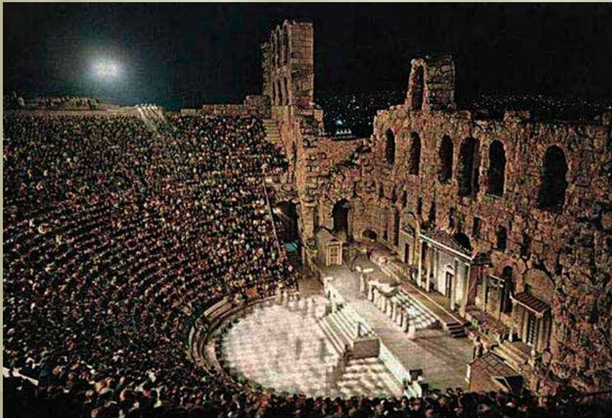
Театрон — здание греческого