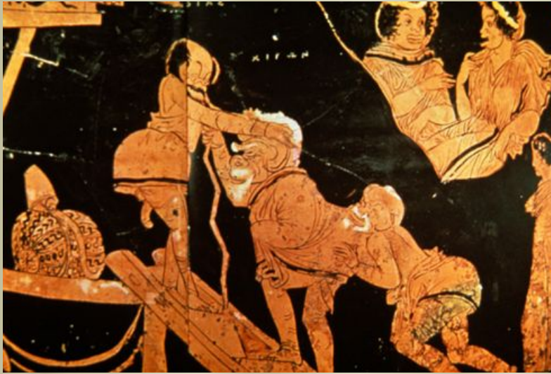
Сцена из древнегреческой комедии. Рисунок на вазе.