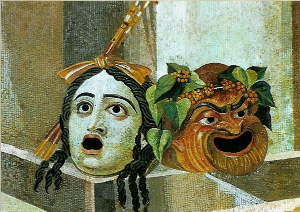
Театральные маски. Мозаика виллы Адриана в Тиволи (II век).