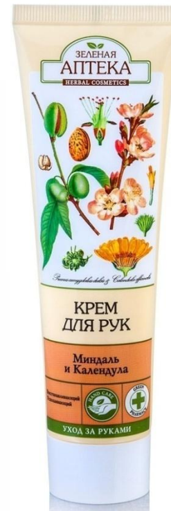
Крем для рук