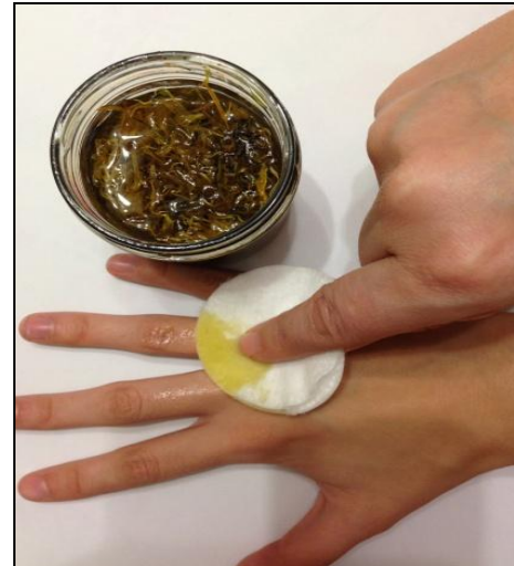
Процесс лечения маслом календулы