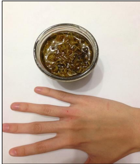
Подготовка кисти руки к лечению