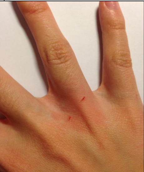
Поврежденная поверхность кожи кисти руки