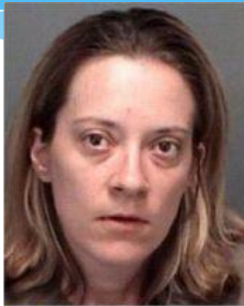
1 AGE: 33