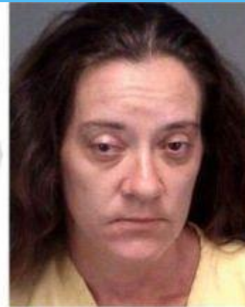
2 AGE: 37