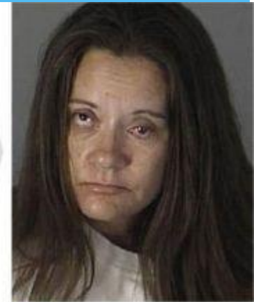
3 AGE: 39