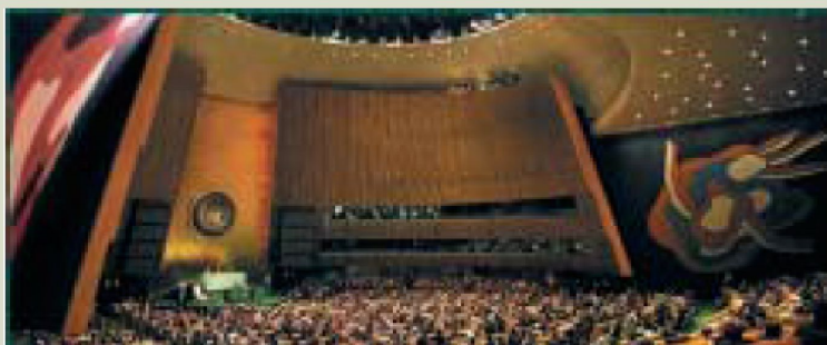
Сессия Генеральной Ассамблеи ООН

ООН — международная организация, главными задачами которой являются поддержание мира и безопасности, развитие дружественных отношений между странами, сотрудничество в разрешении международных проблем и др., в т.ч. борьбой с наркоманией, токсикоманией и алкоголизмом, а также контролем за оборотом наркотических средств, психотропных веществ и их прекурсоров, сильнодействующих и ядовитых веществ