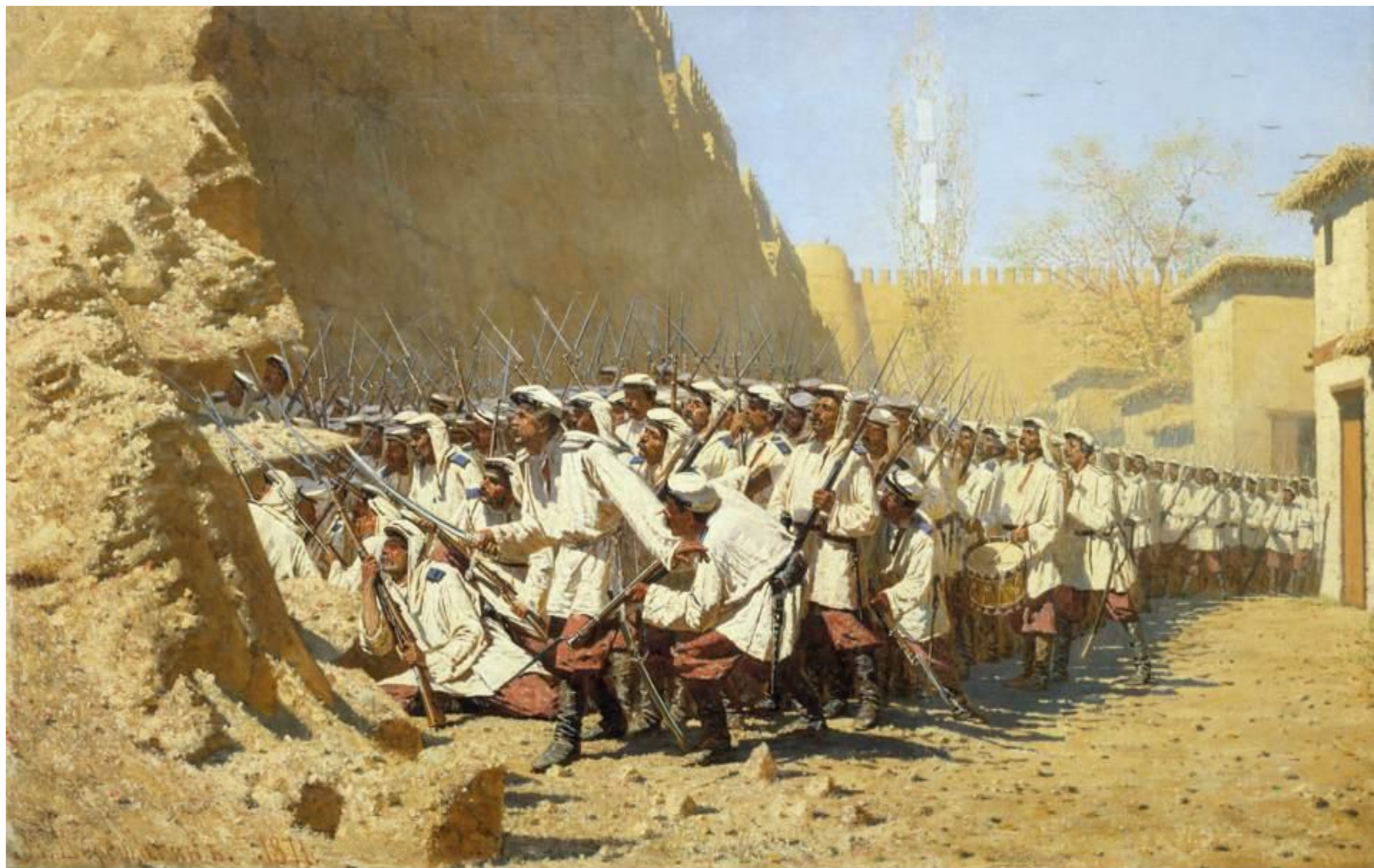
Vasily Vasilyevich Vereshchagin (1842-1904) - At the fortress wall. "Let them enter!" (1871). Painting commemorating the capture of Khiva (in present-day Uzbekistan) by Russian Imperial troops.