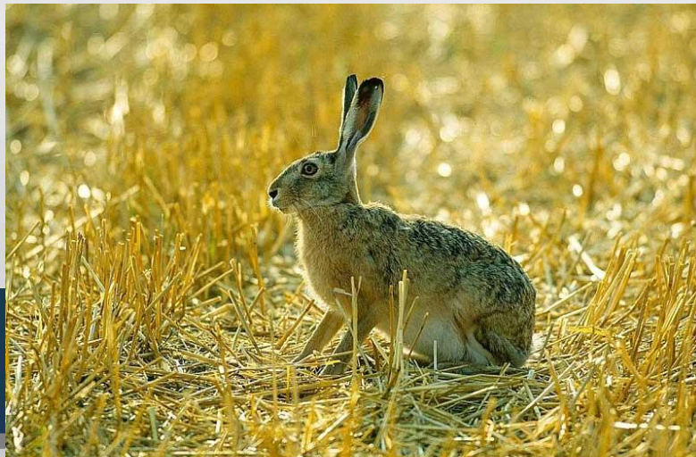
Заяц русак – Lepus europaeus