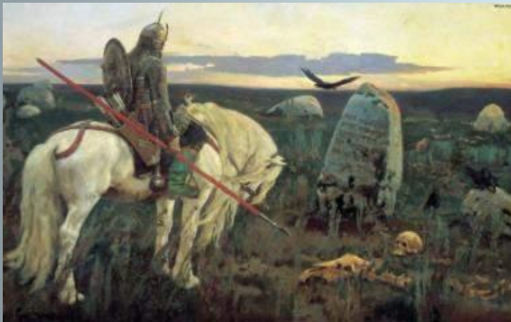
Витязь на распутье