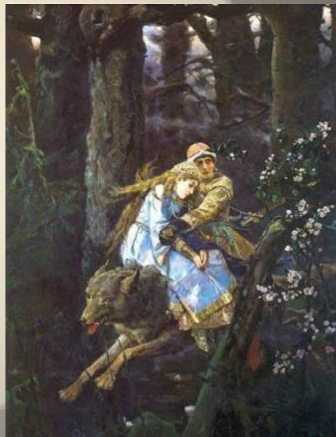
Васнецов В.М. Иван-царевич на сером волке.