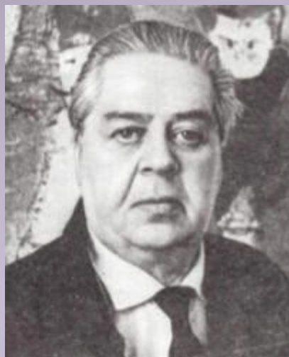
Юрий Алексеевич Васнецов