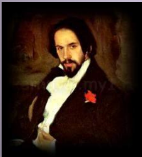
Иван Яковлевич Билибин