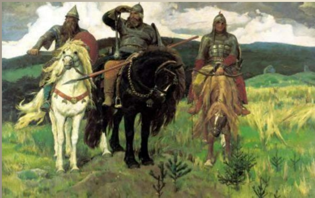
Васнецов В.М. Богатыри.

Художник – иллюстратор помогает нам лучше понять текст, раскрывает его содержание в зрительных образах. Красочные картинки помогают раскрыть характер героя.