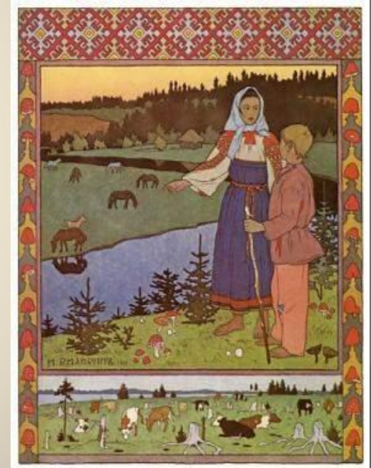
Сестрица Алёнушка и братец Иванушка