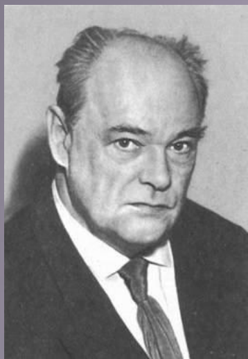
Евгений Иванович Чарушин