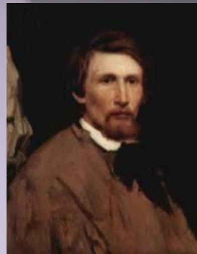
Виктор Михайлович Васнецов