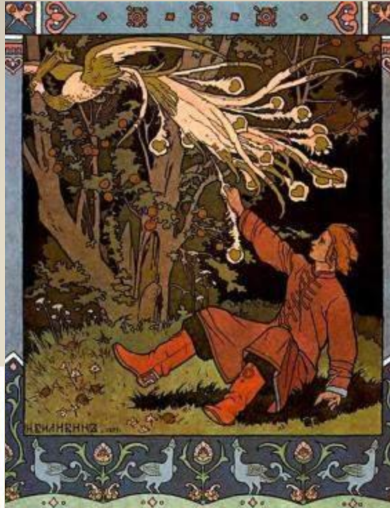
Иван-царевич и Жар-птица.