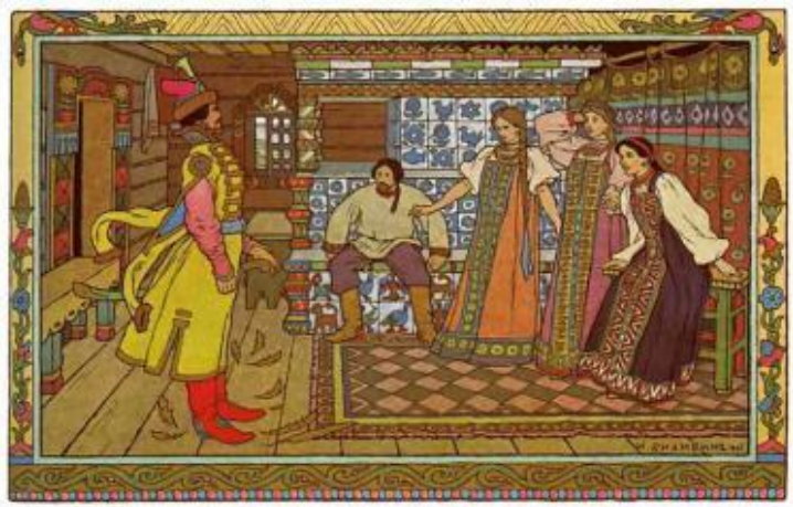
Добрый молодец, Иван-царевич и три его сестры