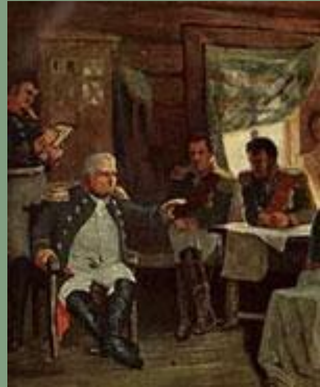
А. Кившенко. Военный совет в Филях