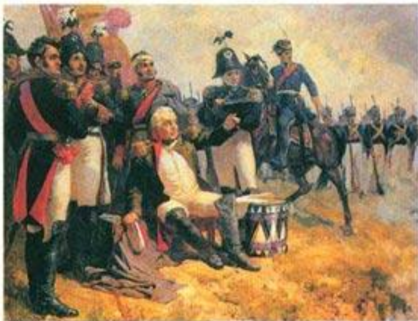
А. Шепелюк М.И. Кутузов на командном пункте в день Бородинского сражения

М.И. Кутузов на командном пункте В день Бородинского сражения