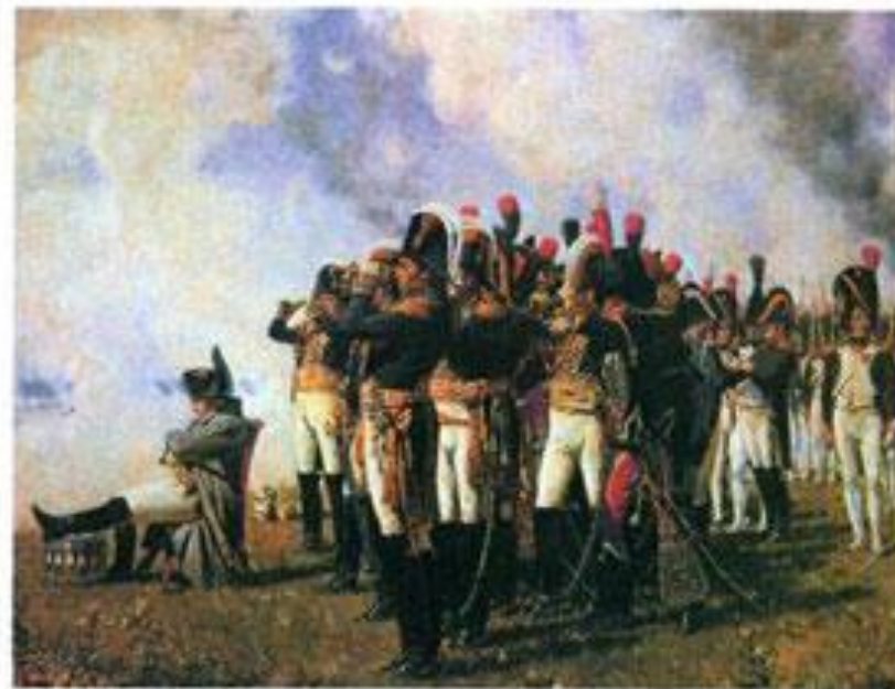
В. Верещагин Наполеон I на Бородинских высотах