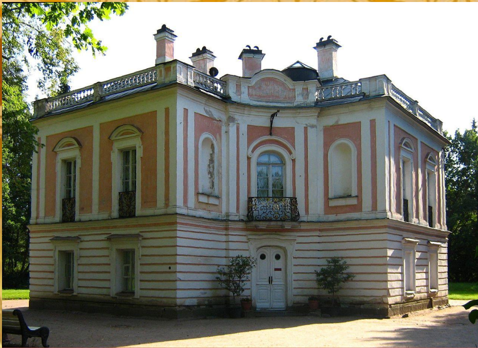
Ораниенбаум, дворец Петра III. Возведён для будущего императора по проекту архитектора Антонио Ринальди в 1758 – 1760

После этого Пётр совершенно пал духом и, вновь отвергнув совет Миниха направиться к восточнопрусской армии, вернулся в Ораниенбаум, где и подписал отречение от престола.