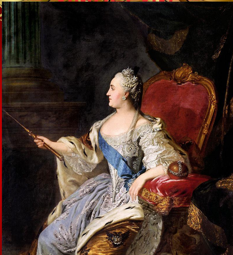
Портрет Екатерины II. Ф. Рокотов, 1763