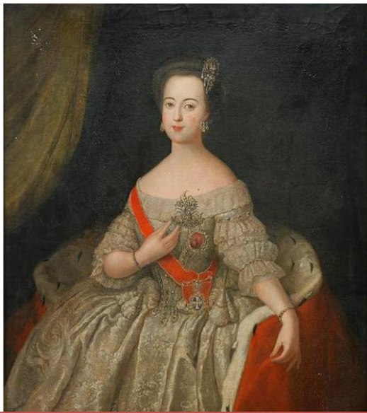
Антуан Пэн Портрет Екатерины, привезенный на смотрины

Екатерина продолжает заниматься самообразованием. Она читает книги по истории, философии, юриспруденции, сочинения Вольтера, Монтескье, Тацита, большое количество другой литературы. Основными развлечениями для неё стали охота, верховая езда, танцы и маскарады.