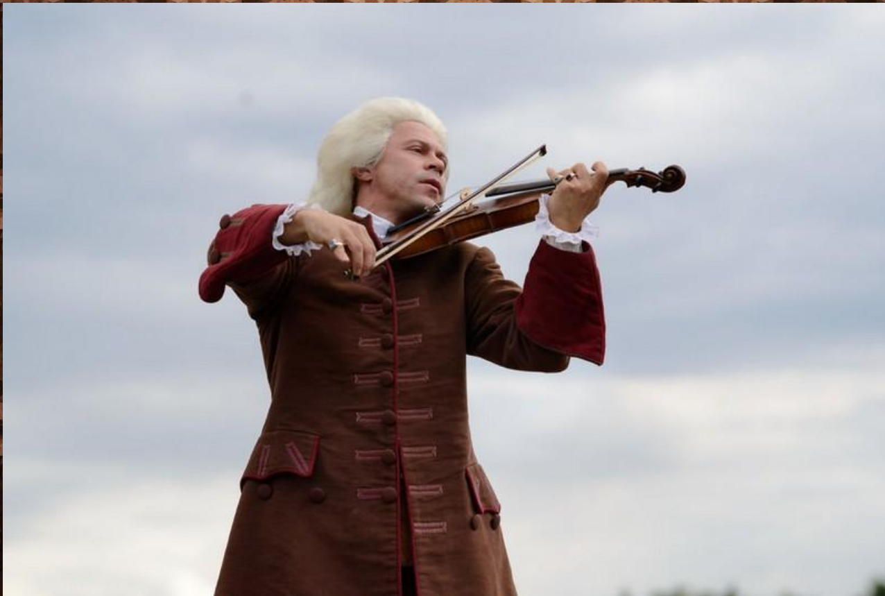
Кадры из фильма «Великая»

Эти голштинские солдаты некоторое время спустя составили гарнизон потешной крепости Петерштадт, построенной в резиденции великого князя Ораниенбауме. Другим увлечением Петра была игра на скрипке.