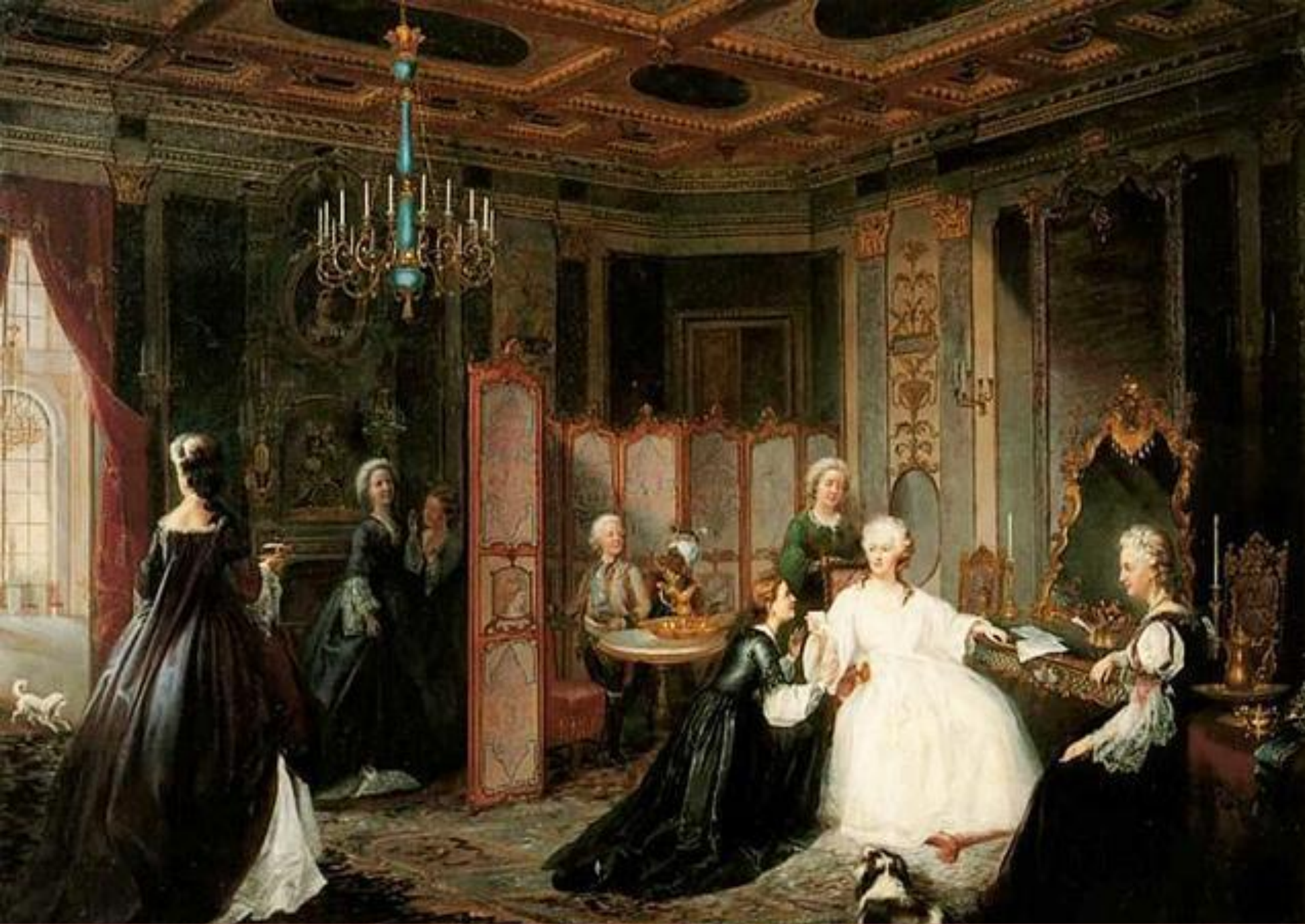
Иван Миодушевский «Вручение письма Екатерине II», 1861 год