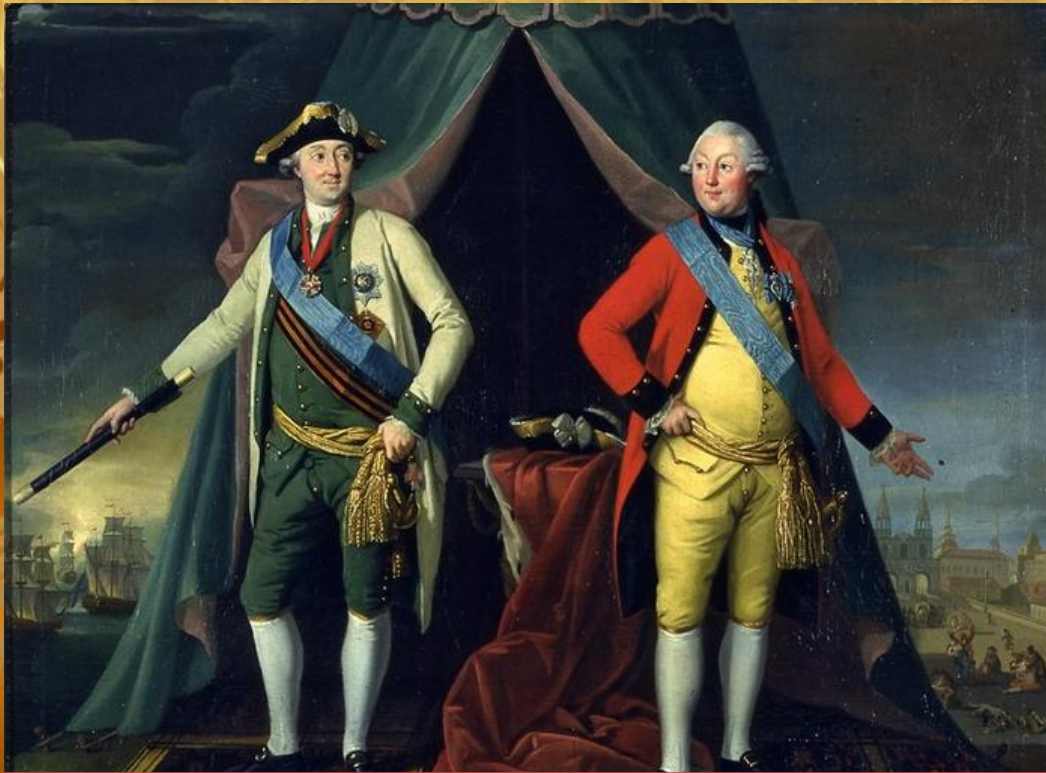
Братья Алексей и Григорий Орловы

Утром 28 июня 1762 года, накануне Петрова дня, император Пётр III со свитой отправился из Ораниенбаума, своей загородной резиденции, в Петергоф , где должен был состояться торжественный обед в честь тезоименитства императора. Накануне по Петербургу прошёл слух, что Екатерина содержится под арестом. В гвардии началась сильнейшая смута; один из участников заговора, капитан Пассек, был арестован; братья Орловы опасались, что возникла угроза раскрытия заговора.