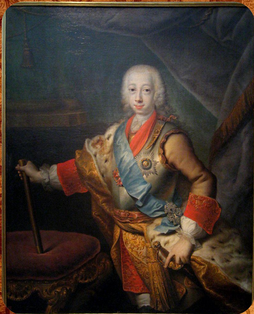
Пётр Фёдорович в бытность Великим князем. Портрет работы Г. Гроота

Бездетная Анна Иоанновна , желавшая закрепить трон за линией Милославских, постоянно считала угрозой этого внука Петра Великого и с ненавистью называла его «ГОЛШТИНСКИМ чертушкой»