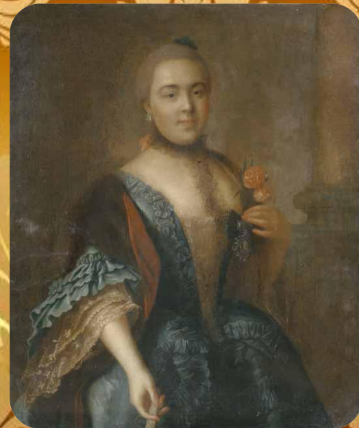
Портрет Елизаветы Воронцовой А. Антропова