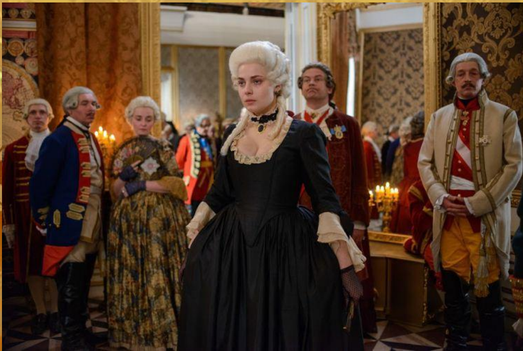
Кадры фильма «Великая»

Пётр III открыто говорил, что собирается развестись с супругой, чтобы жениться на своей фаворитке Елизавете Воронцовой. Он грубо обращался с женой, а 9 июня, во время торжественного обеда по случаю заключения мира с Пруссией случился прилюдный скандал. Император в присутствии двора, дипломатов и иностранных принцев крикнул жене через весь стол « folle » (дура); Екатерина заплакала.