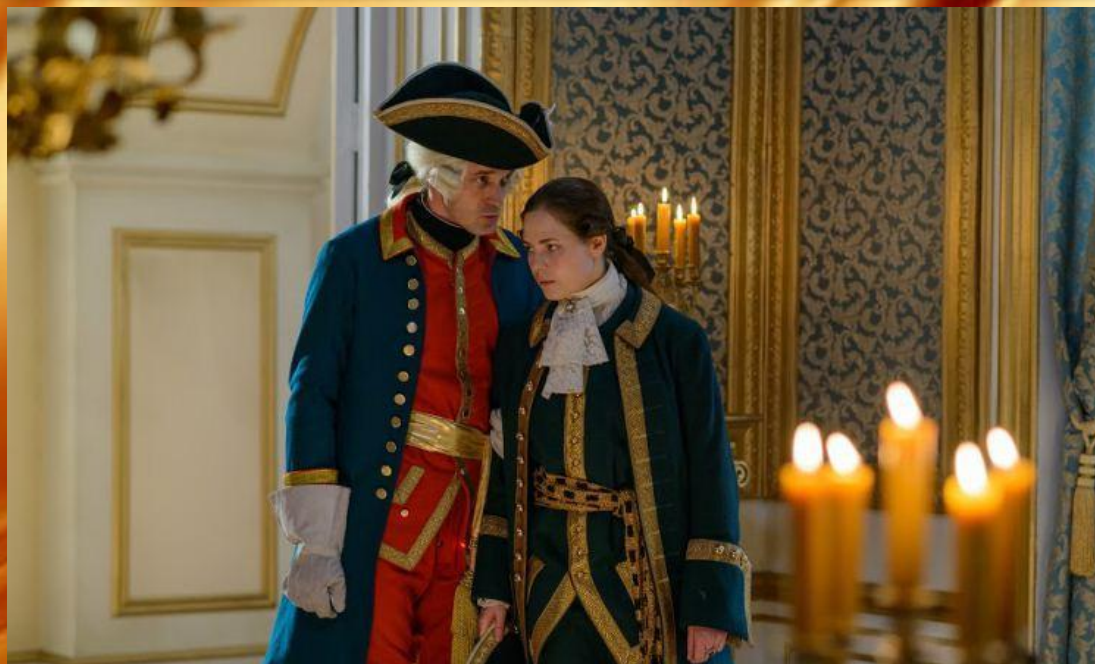
Григорий Орлов и Екатерина II. Кадры из фильма «Великая»

Действительно, друзья Екатерины предлагали ей не сидеть сложа руки, а, используя всеобщую ненависть к Петру, свергнуть его, заточить в каземат, чтобы самой править как самодержице или как регентше при малолетнем императоре Павле I. Ситуация начала лета 1762 года этому благоприятствовала: особенно негодовали армия и гвардия - им предстояло вскоре садиться на суда и плыть на войну с Данией, которой российский император хотел отомстить за аннексию в 1702 году части Голштинского герцогства. Эта война была непопулярна, как и прусского покроя мундиры, в которые переодели армию.