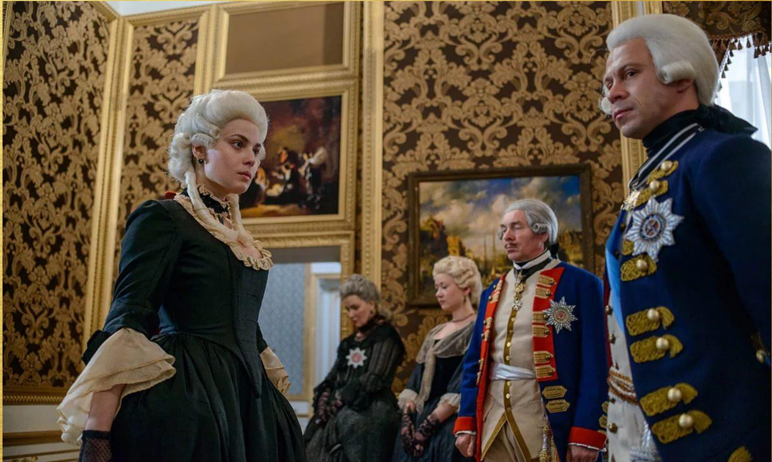
Кадры из фильма «Великая»

Имя императрицы даже не было упомянуто в манифесте о восшествии Петра III на престол, что император публично унижал свою царственную супругу, что она, полная идей, знаний, честолюбивых помыслов и стремлений, не получила и тени реальной власти.