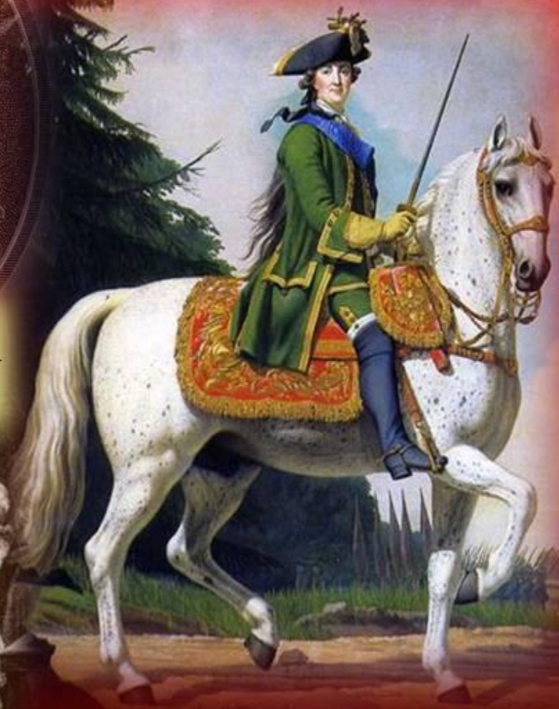
Эриксен В. Конный портрет Екатерины II. 1762