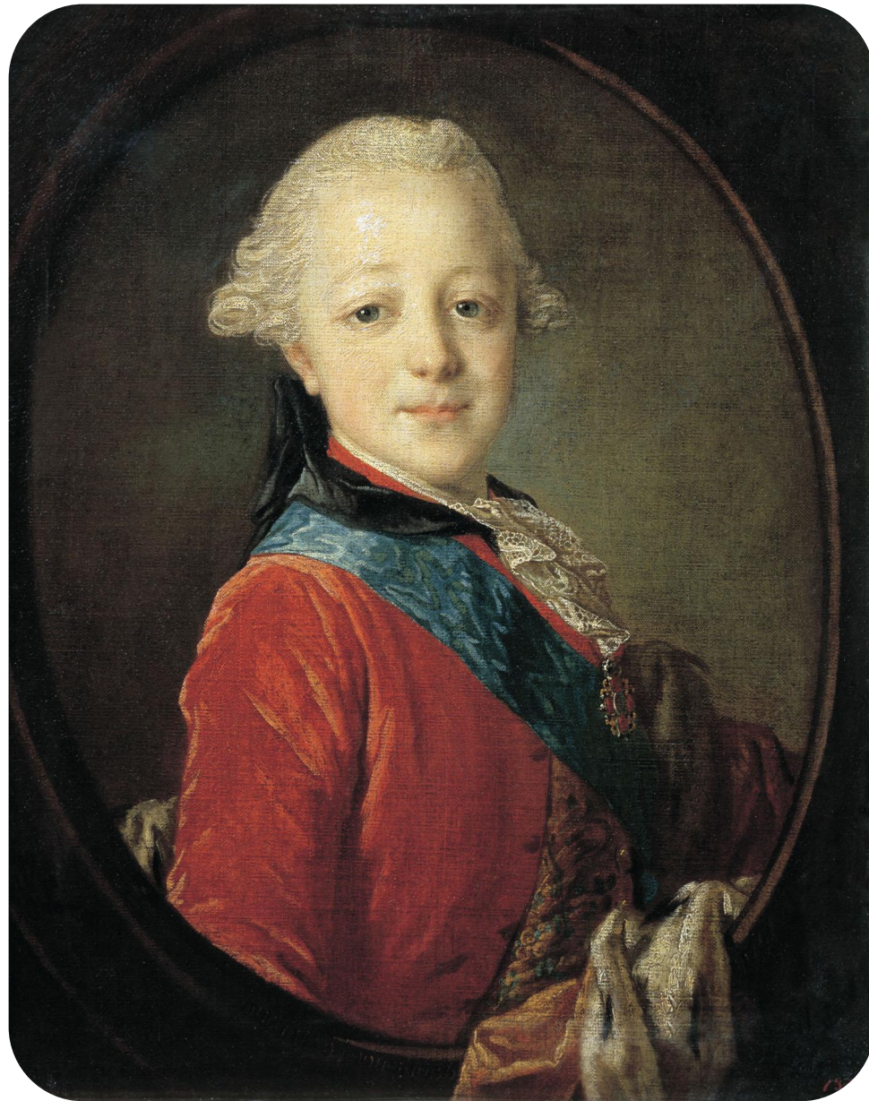
Фёдор Рокотов. Портрет великого князя Павла Петровича в детстве. 1761.