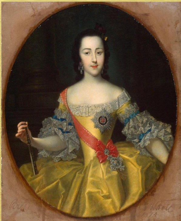
Георг Гроот. Портрет великой княгини Екатерины Алексеевны.

что истинным отцом будущего императора Павла I был не великий князь Петр Федорович, а камергер его двора Сергей Васильевич Салтыков.