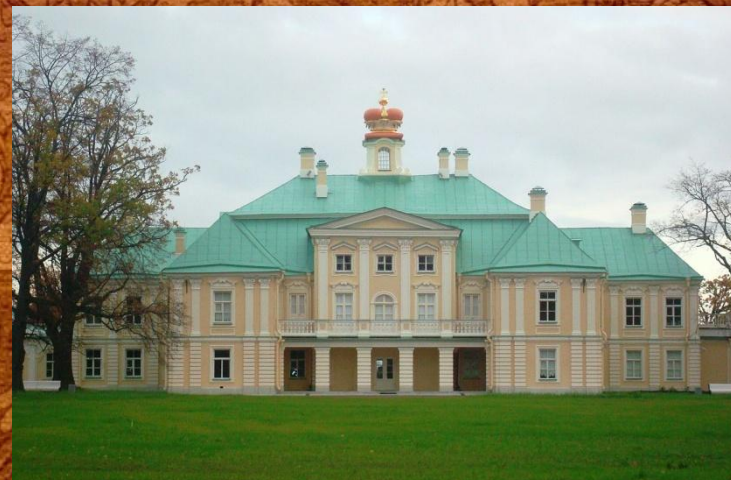
Большой дворец в Ораниенбауме под Петербургом

Свадьба наследника была сыграна с особым размахом – так, что перед 10 – дневными торжествами «меркли все сказки Востока».