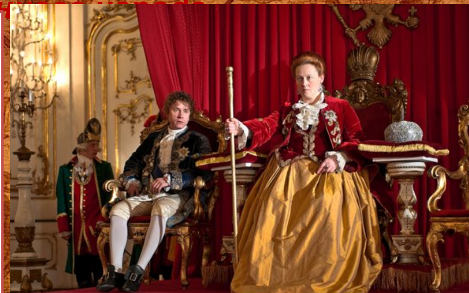
Кадры из фильма «Екатерина»

Елизавета Петровна не допускала Петра к участию в решении политических вопросов. Между тем Великий князь открыто критиковал деятельность правительства, а во время Семилетней войны публично высказывал симпатии к прусскому королю Фридриху II .