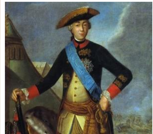
Федор Рокотов. Портрет императора Петра III

Несколько месяцев пребывания у власти выявили противоречивый характер Петра III. Почти все современники отмечали такие черты характера императора, как жажда деятельности, неутомимость, доброта и доверчивость. Я. Я. Штелин писал: «Государь довольно остроумен, особенно в спорах». Император энергично занимался государственными делами.