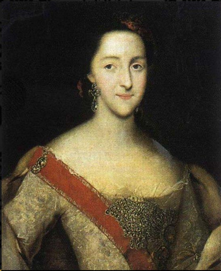
Алексей Антропов. Портрет великой княгини Екатерины Алексеевны. 1753.

Сына Павла сразу же отобрали у матери по воле царствовавшей императрицы Елизаветы Петровны, и лишили Екатерину возможности воспитывать, позволяя только изредка видеть Павла. Так великая княгиня впервые увидела своего сына лишь через 40 дней после родов.