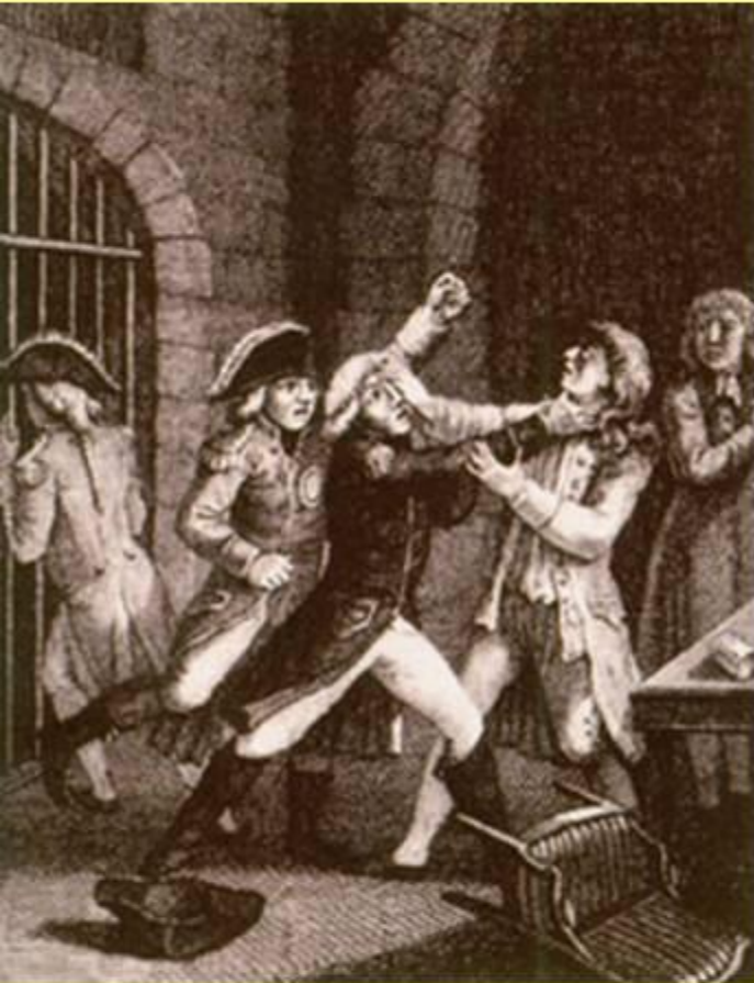
Убийство Петра III в Ропше.

Петра III арестовали и содержали под охраной в замок в Ропше.