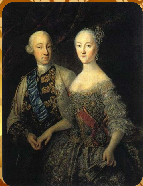
Портрет Петра Федоровича и Екатерины Алексеевны неизвестного художника