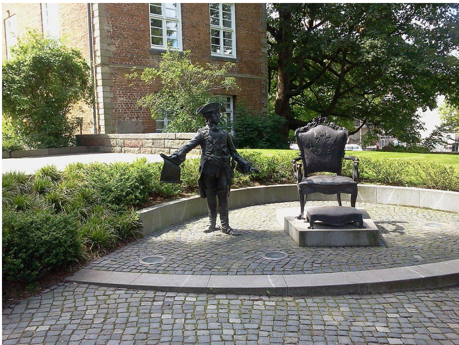
Памятник Петру III в Киле

В изголовных плитах погребённых стоит одна и та же дата погребения (18 декабря 1796), отчего складывается впечатление, что Пётр III и Екатерина II прожили вместе долгие годы и умерли в один день.