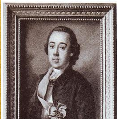
Сергей Васильевич Салтыков

20 сентября 1754 года, через девять лет после свадьбы, Екатерина родила мальчика, названного Павлом. Вокруг его происхождения сразу же возникло немало слухов. Самый устойчивый из них гласил,