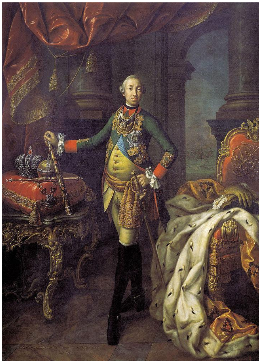
Портрет Петра III в мундире лейб-гвардии Преображенского полка А. Антропова 1762 года