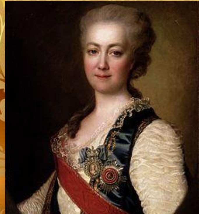
Д.Г. Левицкий. Екатерина Дашкова