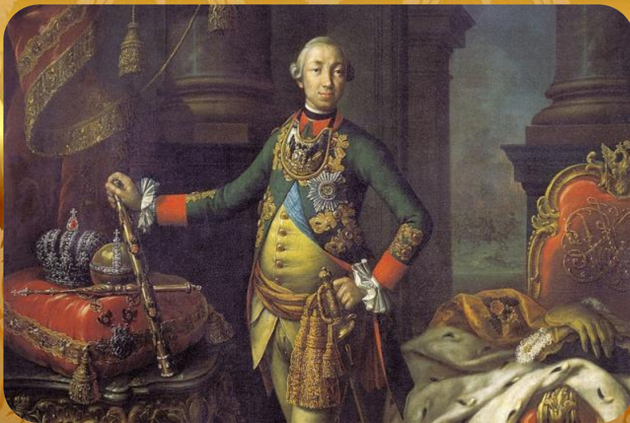
Портрет Петра III работы художника А. П. Антропова, 1762.

25 декабря 1761 года был провозглашен императором. Правил 186 дней. Не короновался (был коронован посмертно императором Павлом I в 1796 году)