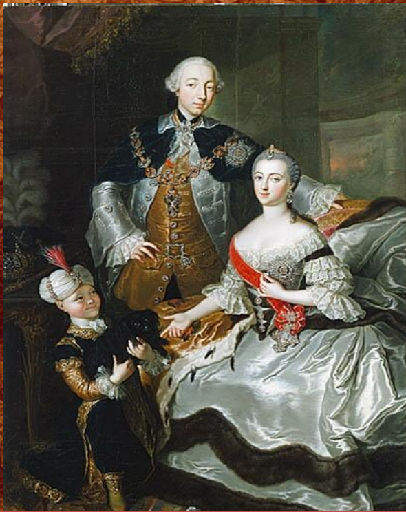
Великая княгиня Екатерина Алексеевна с супругом Петром Федоровичем

В 1745 году его женили на принцессе Екатерине Алексеевне (урожденной Софии Фредерике Августе) Ангальт – Цербстской. В его официальный титул были включены слова «Внук Петра Великого».