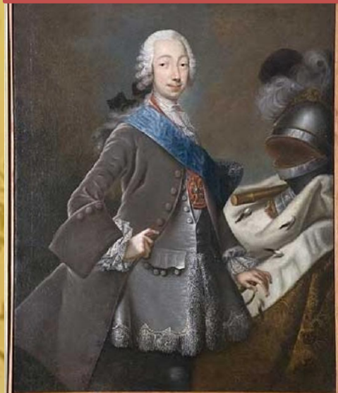
Портрет великого князя Петра Фёдоровича неизвестного художника

Стремясь как можно быстрее выучить русский язык, будущая императрица занималась по ночам, сидя у открытого окна на морозном воздухе.