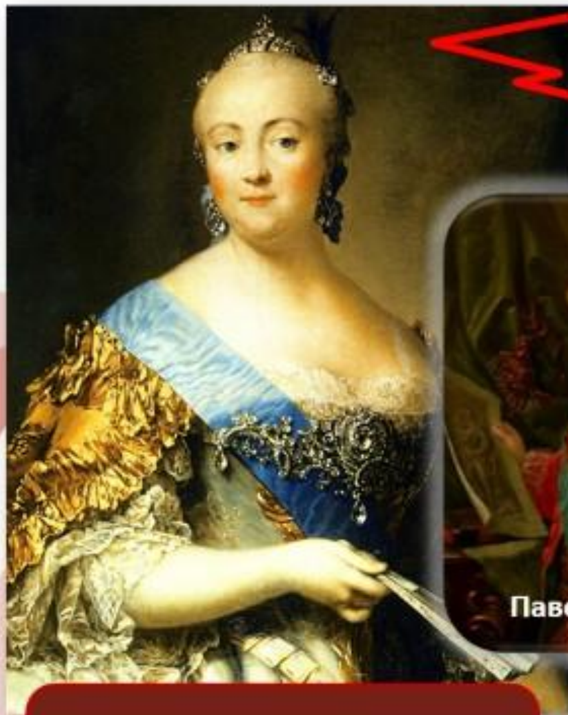
Елизавета Петровна. Художник Вигилиус Эриксен.