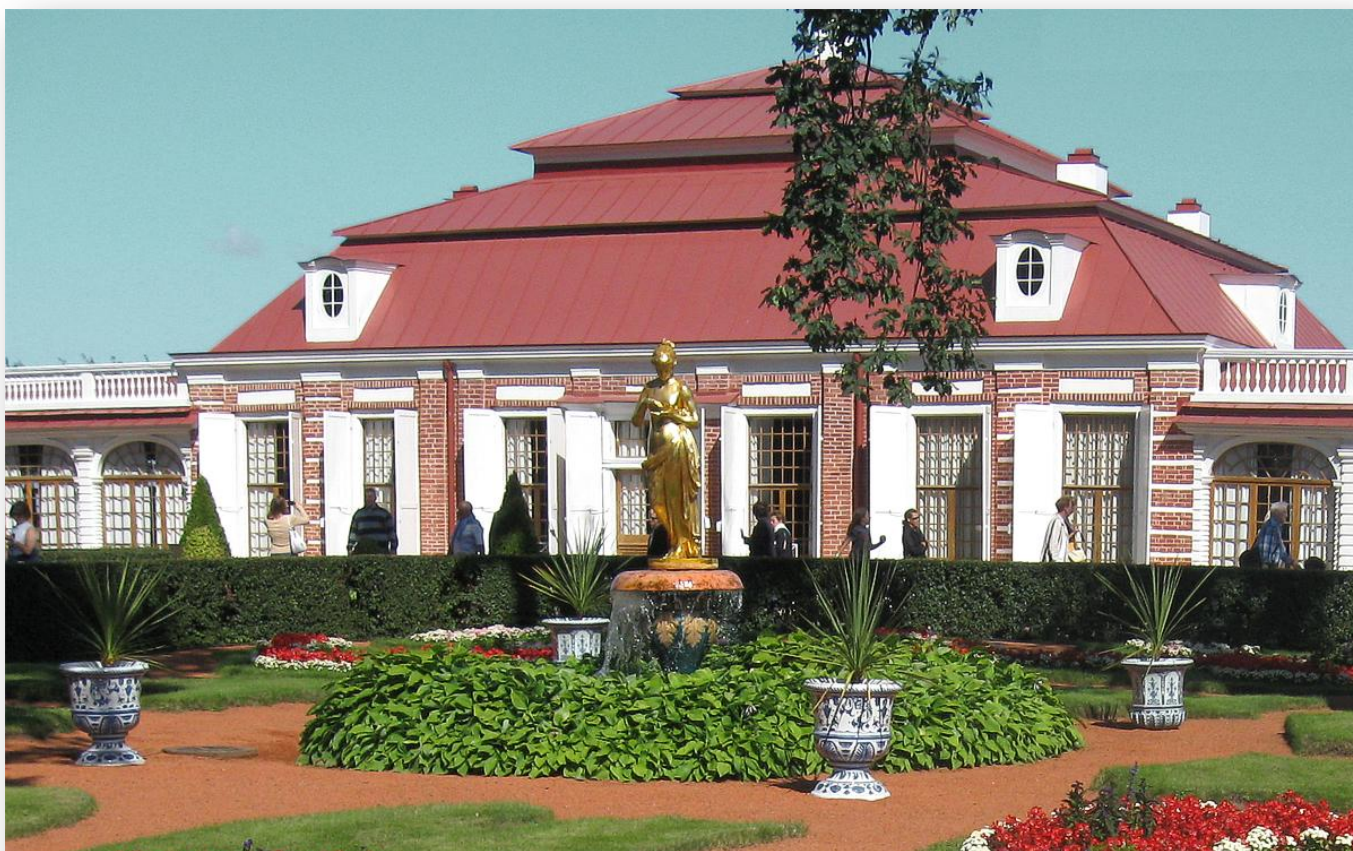
Дворец Монплезир в Петергофе

28 июня, накануне дня своего тезоименитства (ведь 29 июня - праздник святых Петра и Павла), Петр вместе с канцлером Воронцовым, фельдмаршалом Б. Х. Минихом, возвращенным им из ссылки, прусским посланником, девицей Воронцовой и прочими «ближними» дамами и кавалерами отправился в Петергоф. Прибыв туда, император и его свита увидели, что дворец Монплезир, в котором жила императрица, пуст, и с удивлением услышали, что она еще в пять часов утра тайно уехала в Петербург.