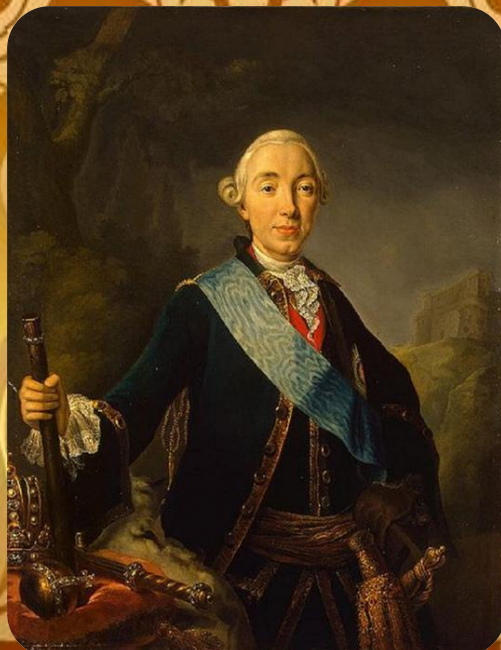
Портрет великого князя Петра Фёдоровича неизвестного художника