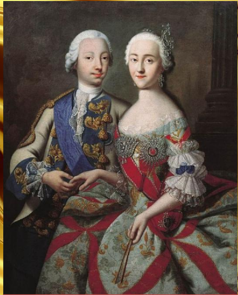
Цесаревич Петр Федорович и великая княгиня Екатерина Алексеевна. 1740-е годы Г.-К. Гроота