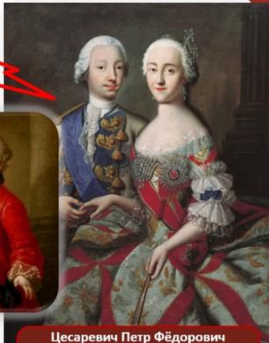
Цесаревич Петр Фёдорович и великая княгиня Екатерина Алексеевна. Художник Георг Гроот. 1740-е гг.