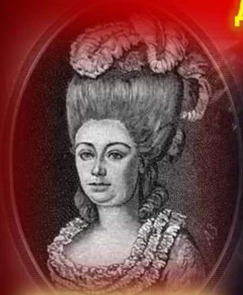
Воронцова Елизавета Романовна — фаворитка Петра III