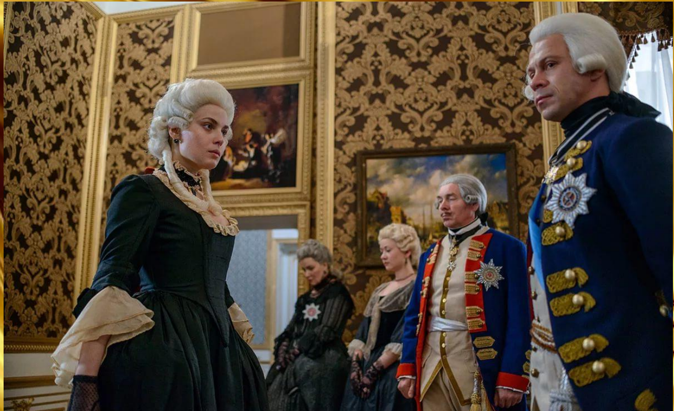
Григорий Орлов и Екатерина II. Кадры из фильма «Великая»

Толчком стал инцидент на торжественном обеде 9 июня 1762 года, когда Петр, разгневавшись на жену, в присутствии знати, генералитета, дипломатического корпуса крикнул ей через весь стол: «Folle!» - «Дура!» За столько лет жизни рядом с Екатериной Петр так и не понял, что женщин, подобных ей, оскорблять нельзя. С этого дня Екатерина стала внимательнее слушать тех, кто советовал ей действовать решительно и быстро.