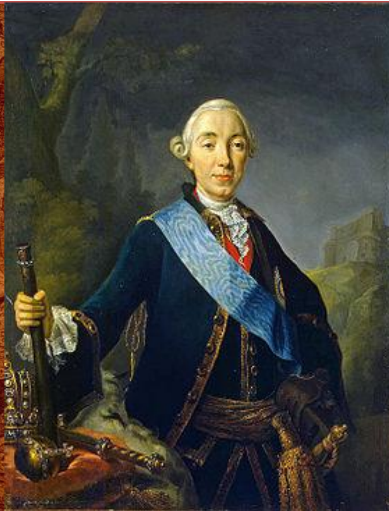
Коронационный портрет императора Петра III Фёдоровича работы Л. К. Пфанцельта