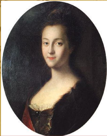
Екатерина после приезда в Россию, портрет кисти Луи Каравака

В 1744 году цербстская принцесса вместе с матерью была приглашена в Россию для бракосочетания с Петром Фёдоровичем, который приходился ей троюродным братом.