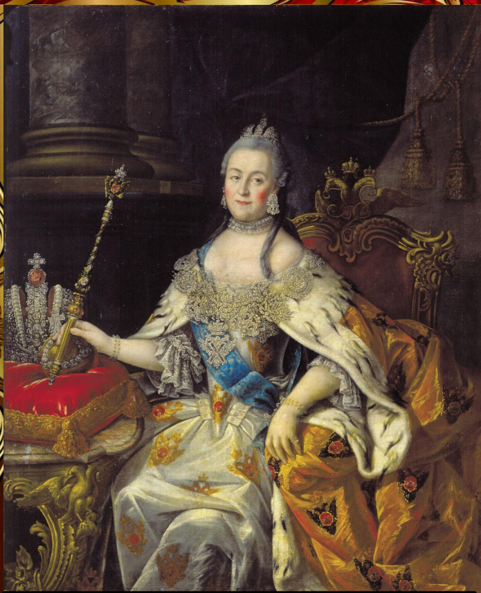
Портрет Екатерины II. А.П. Антропов 1766.

«Она больше дорожила вниманием современнико в, чем мнением потомков»