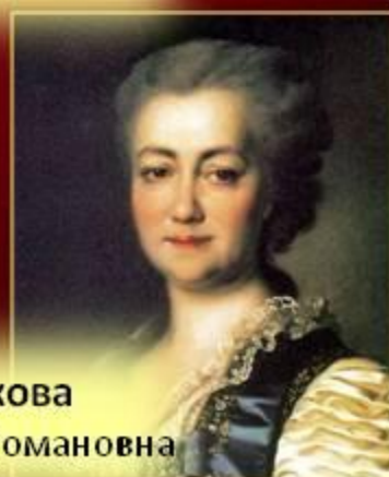
Дашкова Екатерина Романовна

Главные организаторы дворцового переворота 1762 г.