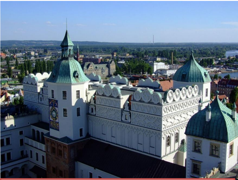
Штеттинский замок, где появилась на свет будущая императрица

София Фредерика Августа Ангальт-Цербстская родилась 21 апреля 1729 года в немецком городе Штеттине — (ныне Щецин , Польша).