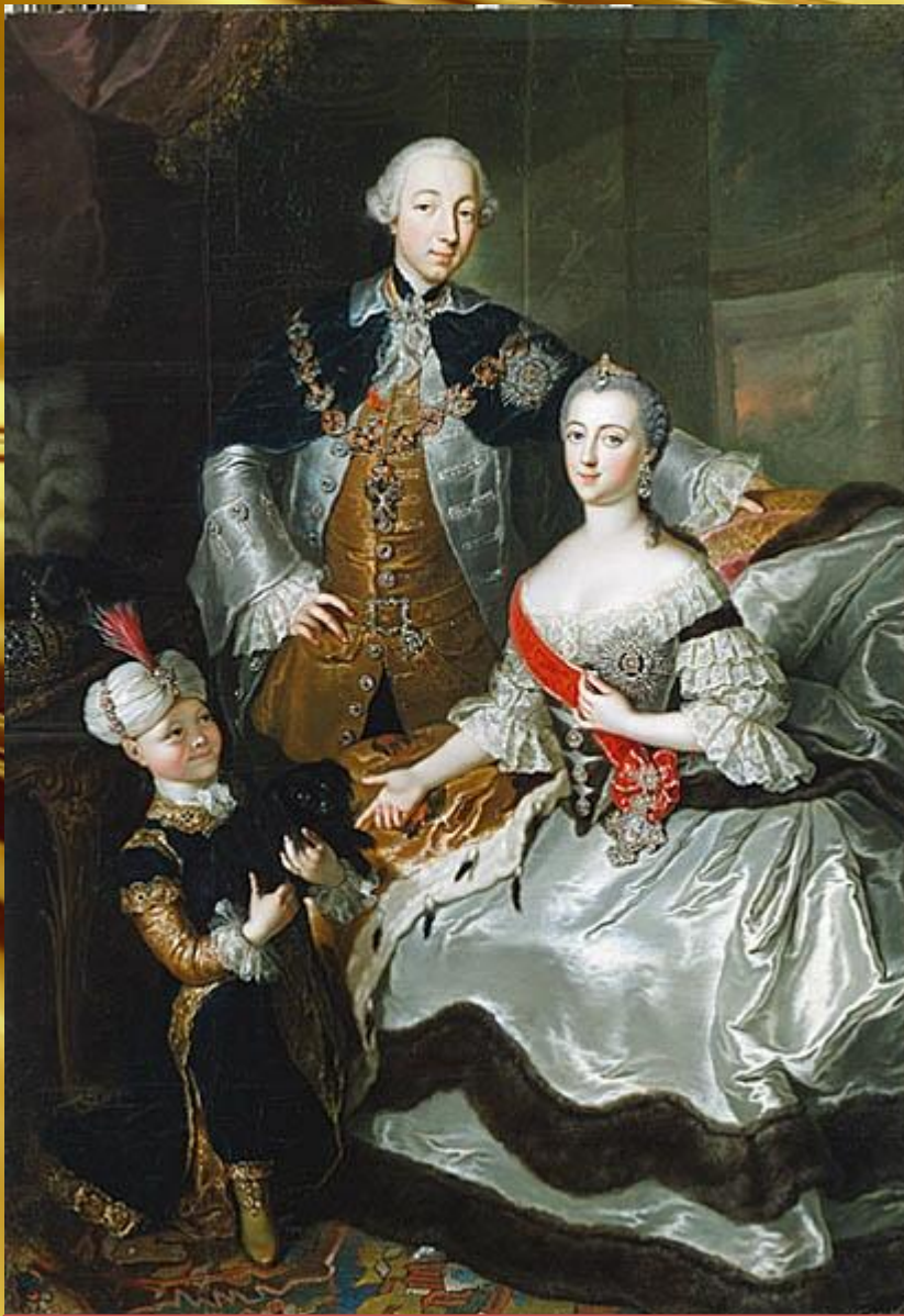
Великая княгиня Екатерина Алексеевна с супругом Петром III Федоровичем