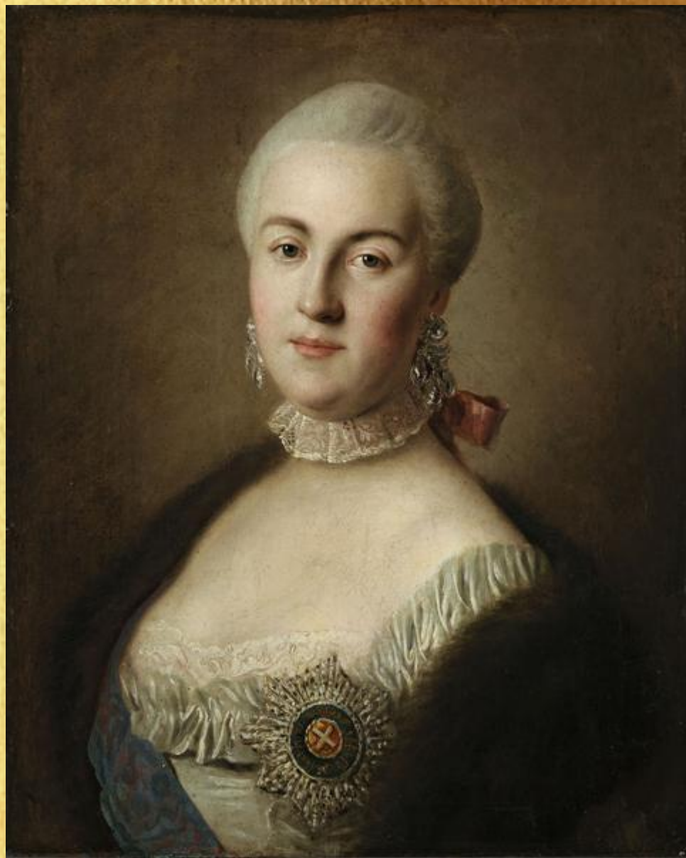
Пьетро (Пьетро Антони) деи Ротари. Портрет великой княгини Екатерины Алексеевны. 1761.