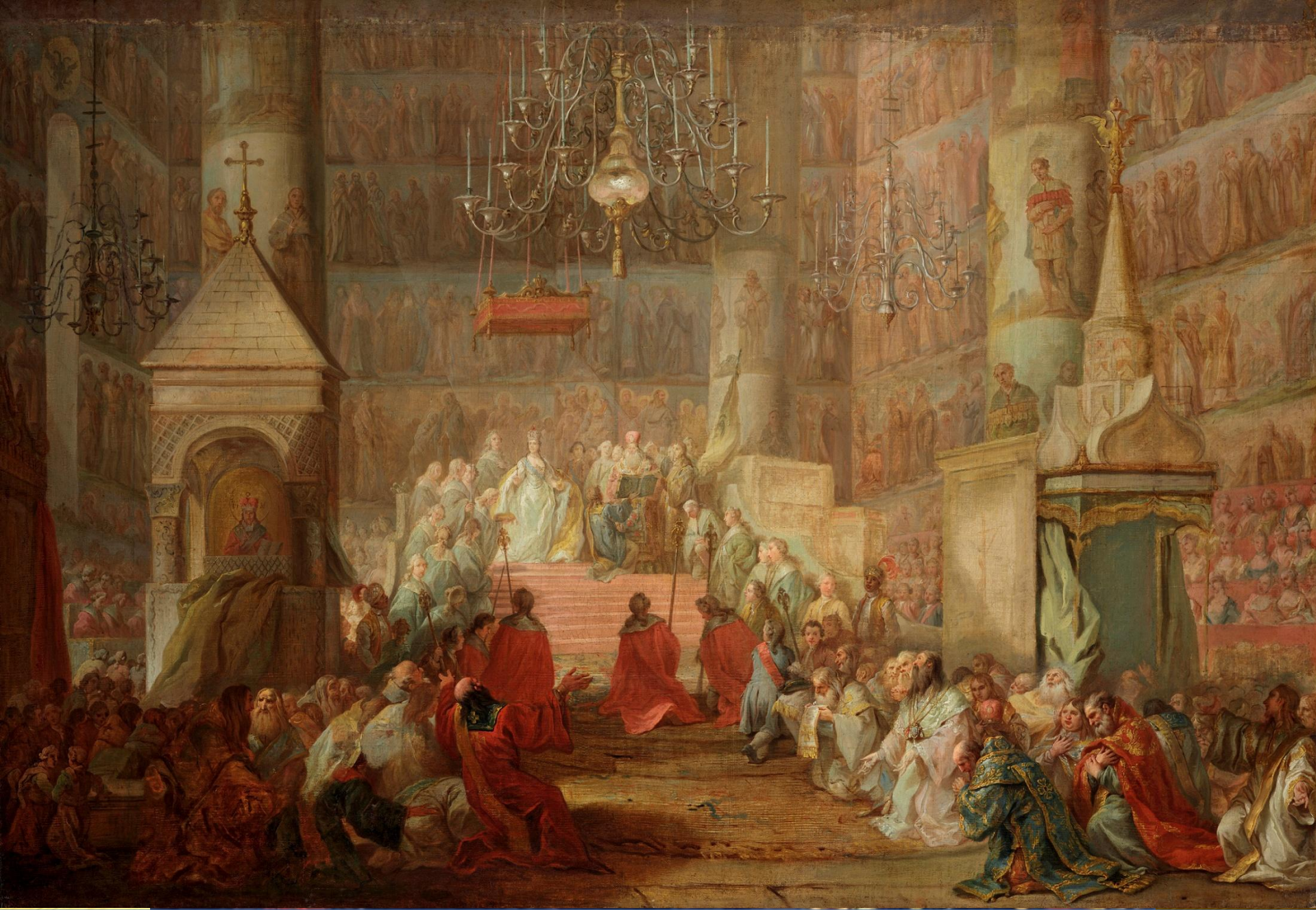
Стефано Торелли. Коронация Екатерины