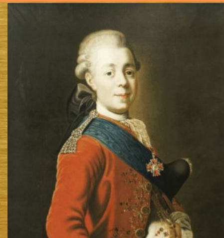
Портрет великого князя Павла Петровича (1777 г.)