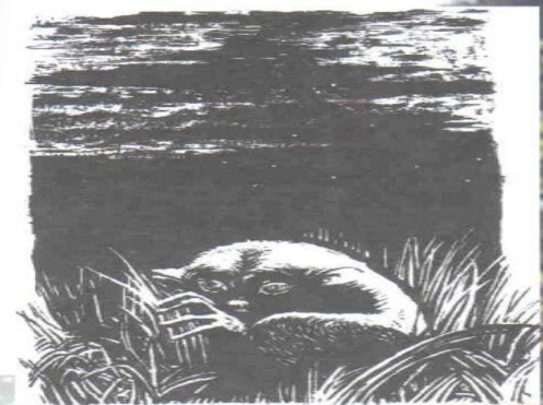
Хозяин Матёры. Худож. Е.П. Ишханова

https://ru.wikipedia.org/wiki/%D0%9F%D1%80%D0%BE%D1%89%D0%B0%D0%BD%D0%B8%D0%B5_%D1%81_%D0%9C%D0%B0%D1%82%D1%91%D1%80%D0%BE%D0%B9