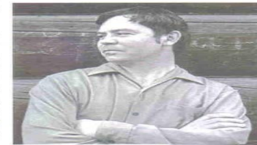
В. Распутин. 1970-е годы

В Аталанке была только начальная четырехклассная школа. Учился я хорошо, с каким-то даже восторгом. Научившись читать, так пристрастился к этому занятию, что читал подряд всё, что было составлено из букв, — куски газет, инструкции и, конечно, книги. Книг в школьной библиотеке водилось совсем немного... На лето школа запиралась. Чтобы добраться до книг, мы с другом шли на «преступление»: вынимали стеклинку в окне, забирались в класс, и книги были в наших руках. Но все было чисть по чести: одни книги увосились, другие возвращались, и никто ни разу наше преступление не раскрыл. Однажды дедушка, постригая мою головенку, обнаружил седой волос, который, вероятней всего, с его