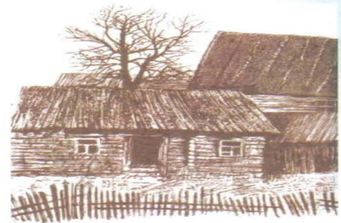
Худож. Е.П. Ишханова