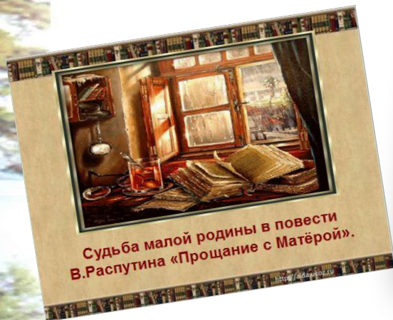
Судьба малой родины в повести В.Распутина «Прощание с Матёрой».