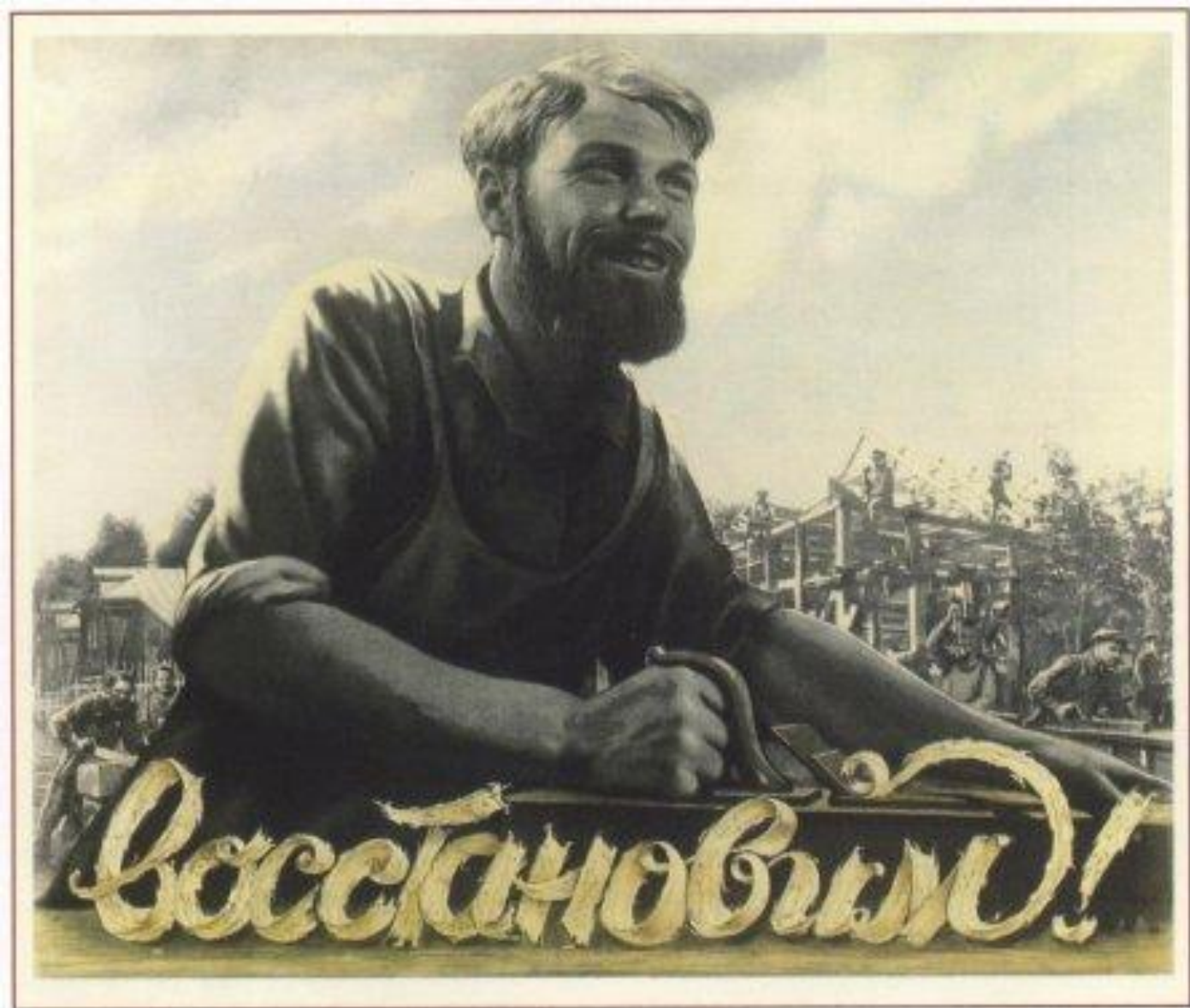
113. Корецкий В. Восстановим! 1947