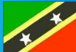
Сент-Китс и Невис

САМОСТОЯТЕЛЬНО ПОЗНАКОМИТЬСЯ С ИНФОРМАЦИЕЙ