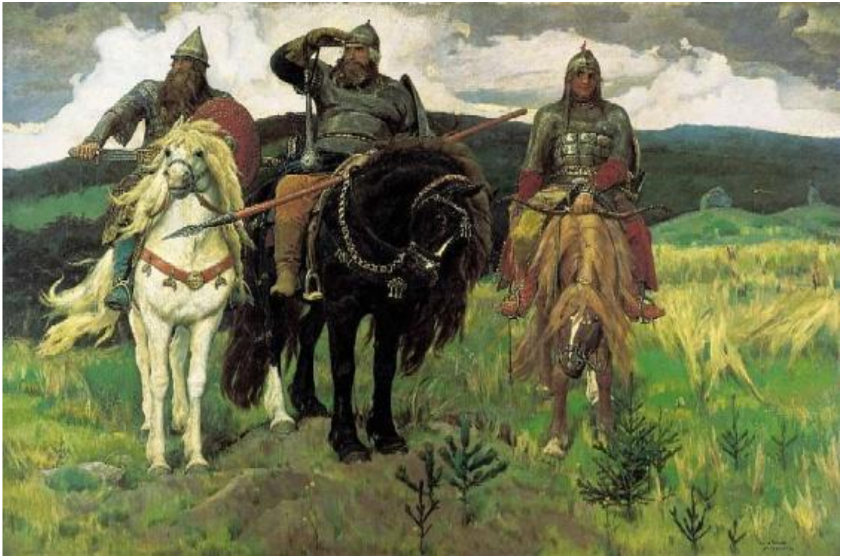
В. Васнецов. Богатыри 1881-1898, холст, масло, 295,3х446 см Государственная Третьяковская галерея, Москва