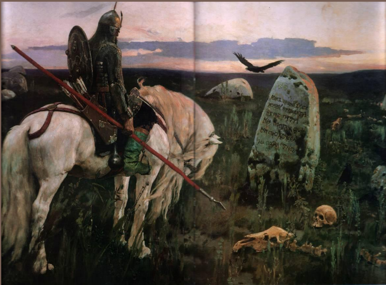
«Витязь на распутье»