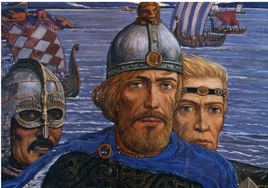
Илья Глазунов «Рюрик, Трувор, Синеус»