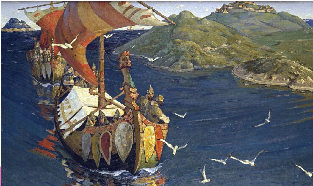
Н. Рерих Заморские гости