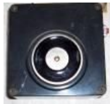
Магнитный держатель на двери