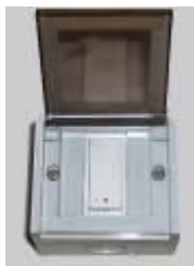
Прерыватель Магнитного держателя двери

Для обеспечения работы и жизнедеятельности судна, переборки Главных Вертикальных Пожарных Зон могут иметь дверные ЭМЫ .