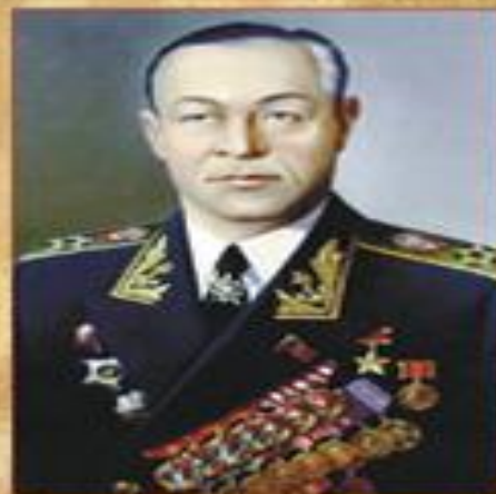
КУЗНЕЦОВ Николай Герасимович (1902 - 1974)