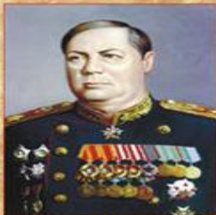
ТОЛБУХИН Федор Иванович (1894 - 1949)