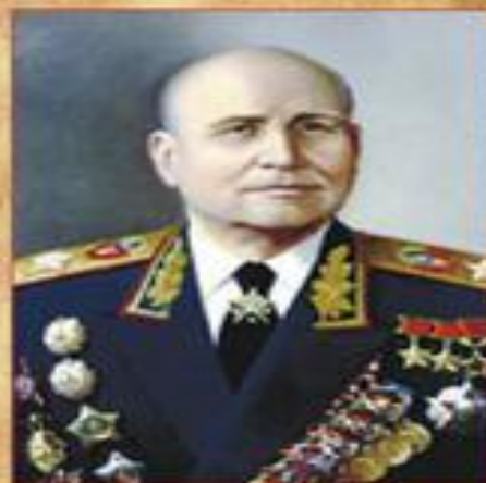
КОНЕВ Иван Степанович (1897 - 1973)