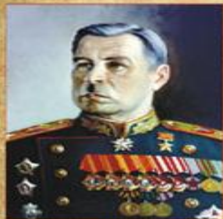
ГОВОРОВ Леонид Александрович (1897 - 1955)