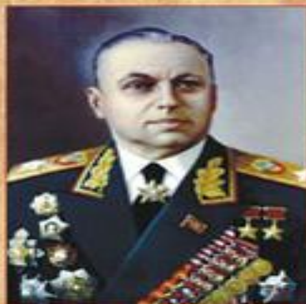
РОКОССОВСКИЙ Константин Константинович (1896 - 1968)