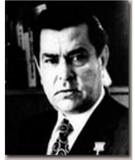
Алексей Петрович Маресьев Летчик, Герои Советского Союза.