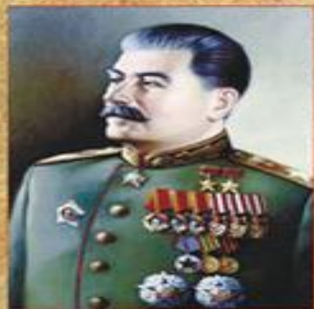
СТАЛИН Иосиф Виссарионович (1879 - 1953)