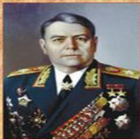
ВАСИЛЕВСКИЙ Александр Михайлович (1895 - 1977)