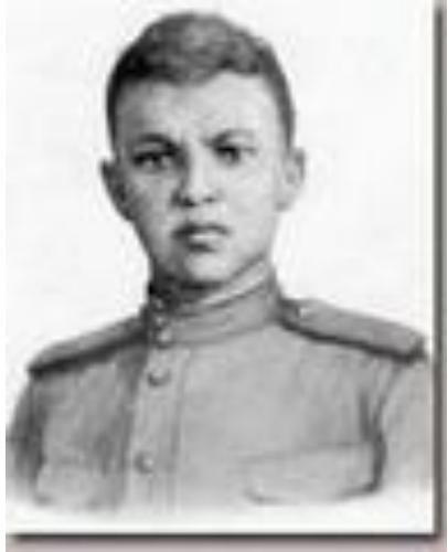
Матросов Александр Матвеевич Стрелок-автоматчик, Герои Советского Союза