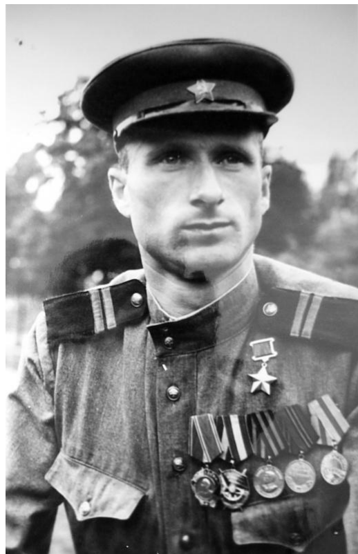
Мелитон Варламович Кантария.

Количество героев ВОВ: русских - 8182 , украинцев - 2072 , белорусов - 311 , татар - 161 , евреев - 108 , казахов - 96 , грузин - 91 , армян - 90 , узбеков - 69 , дагестанцев - 52 и т.д.