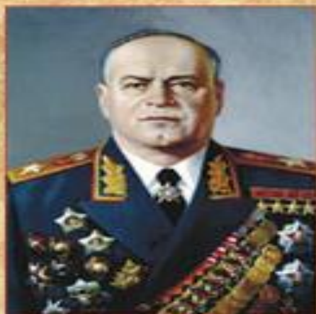
ЖУКОВ Георгий Константинович (1896 - 1974)