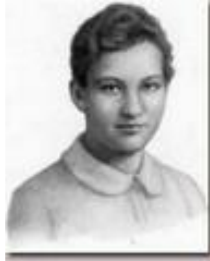
Космодемьянская Зоя Анатольевна Партизанка, Герой Советского Союза