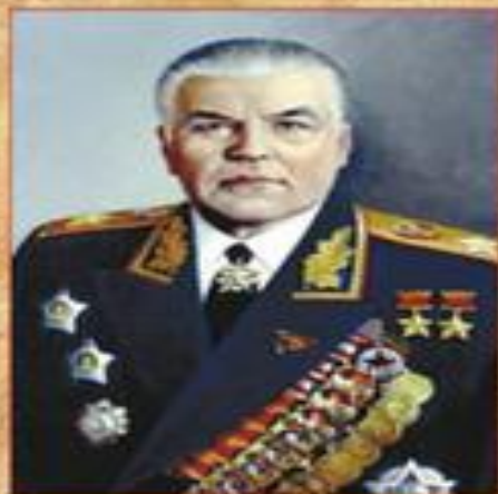
МАЛИНОВСКИЙ Родion Яковлевич (1898 - 1967)