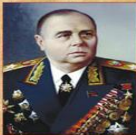
МЕРЕЦКОВ Кирилл Афанасьевич (1897 - 1968)