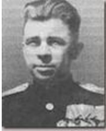
Александр Иванович Маринеско Офицер подводного флота, Герои Советского Союза