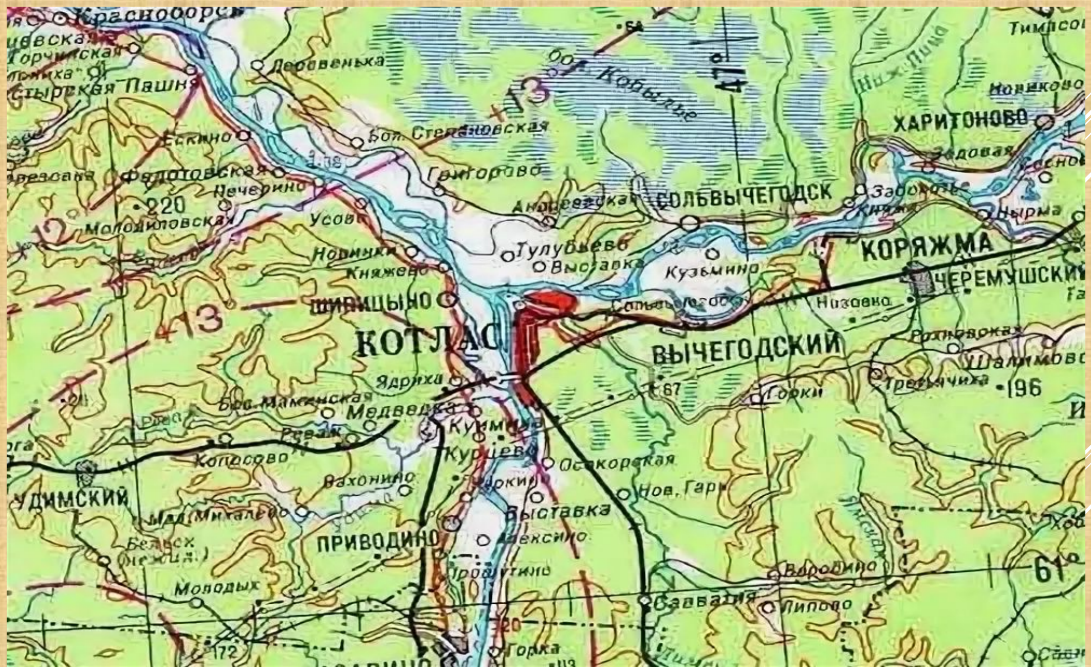
Топографическая карта Котласского района