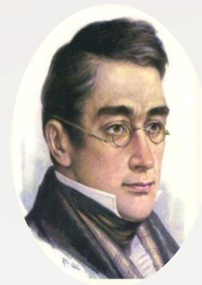
Александр Грибоедов (русский поэт, драматург)