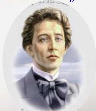
Александр Блок (русский поэт)