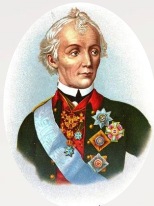
Александр Суворов (русский полководец, генералиссимус)