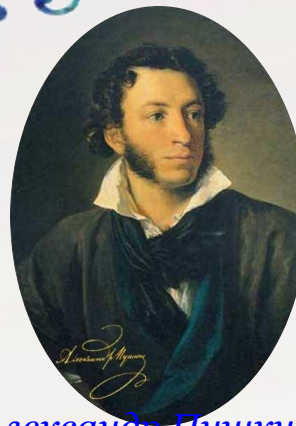
Александр Пушкин (русский поэт)