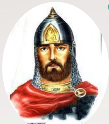
Александр Невский (русский полководец)