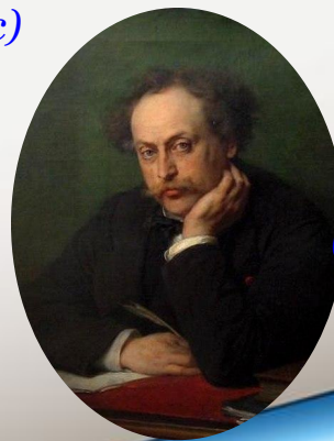
Александр Дюма (французский писатель)