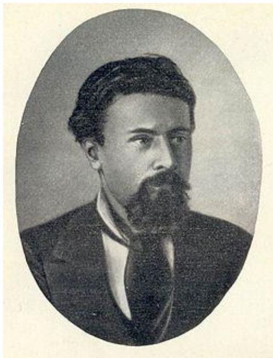
Николай Кибальчич – изобретатель, участник покушения