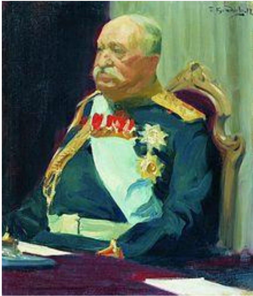
Николай Павлович Игнатъев, Министр государственных имуществ (8.03. 1881 – 30.05.1882)