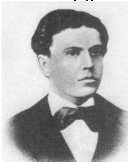
Игнатий Гриневицкий- убил Александра II